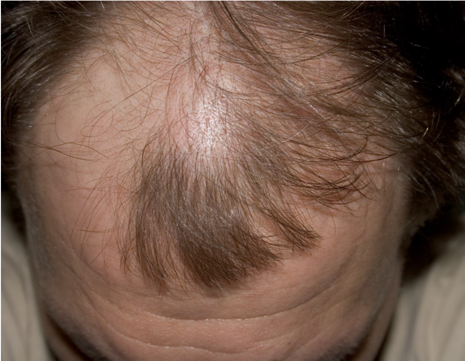
2) Fox.JPG , downloaded 203 times