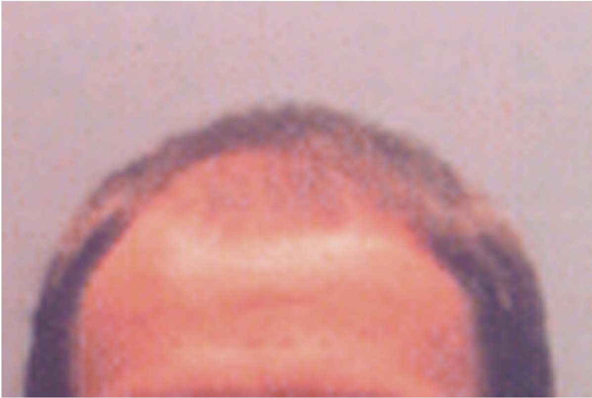
2) Fox.JPG , downloaded 1498 times