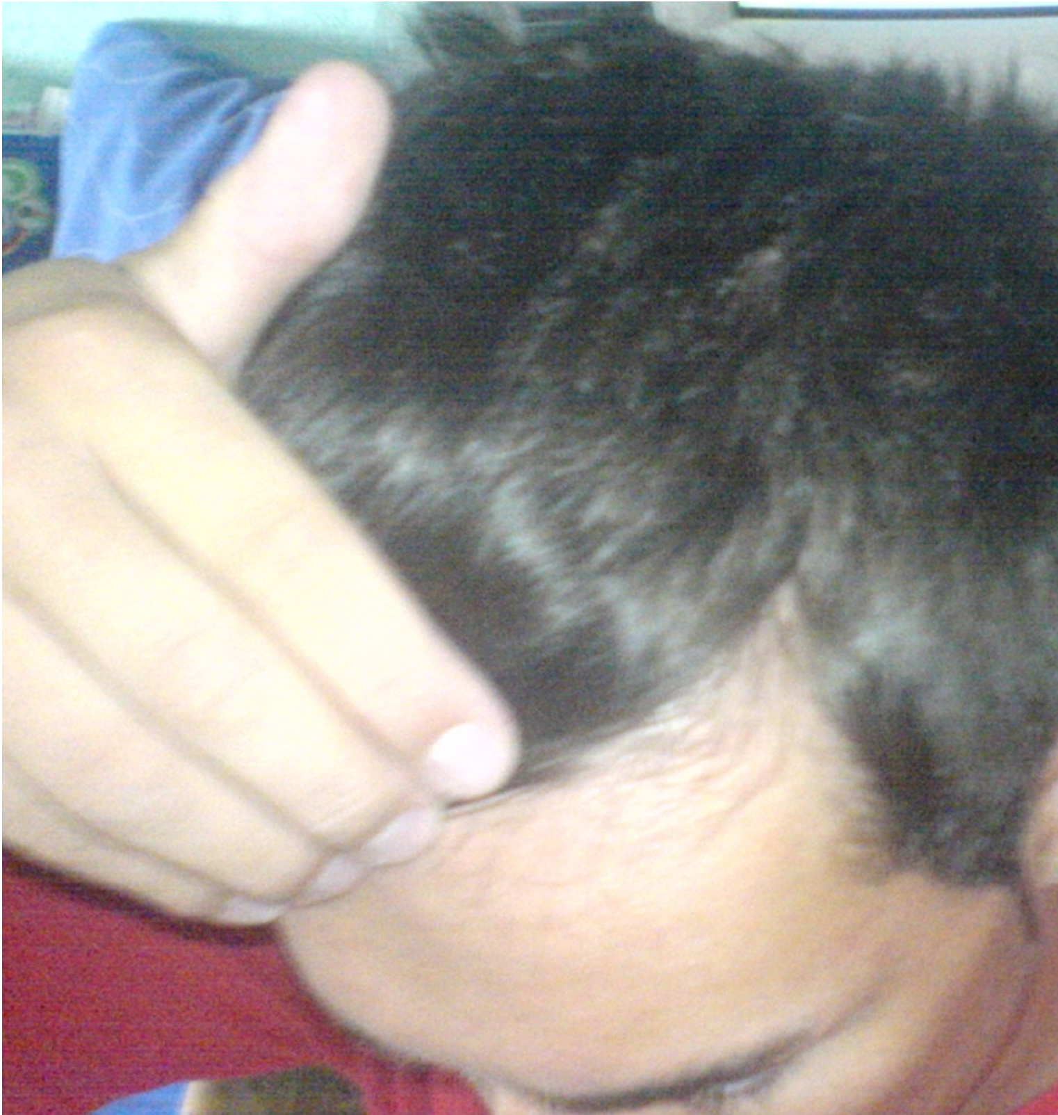
2) Bild2.JPG , downloaded 149 times