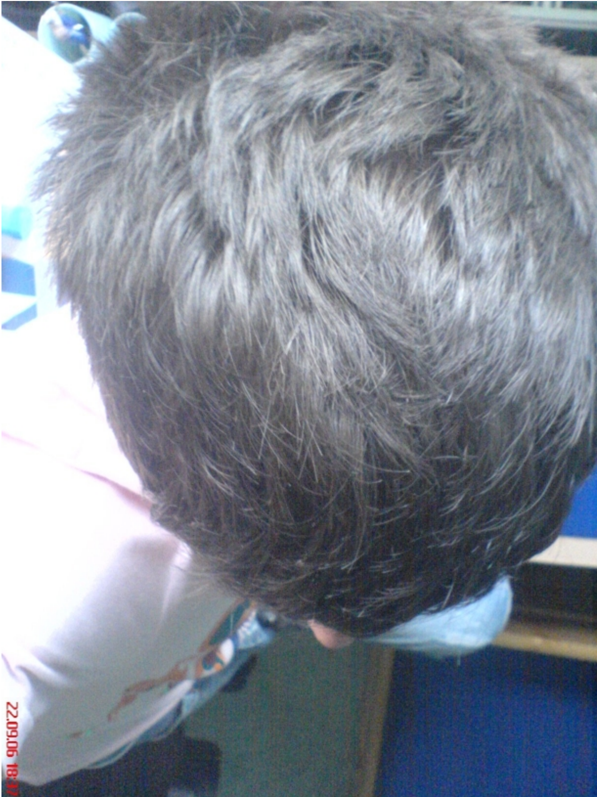
3) DSC01087.JPG , downloaded 226 times