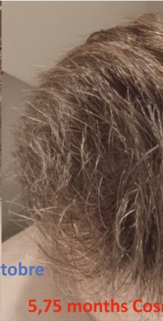
5,75 months Cos