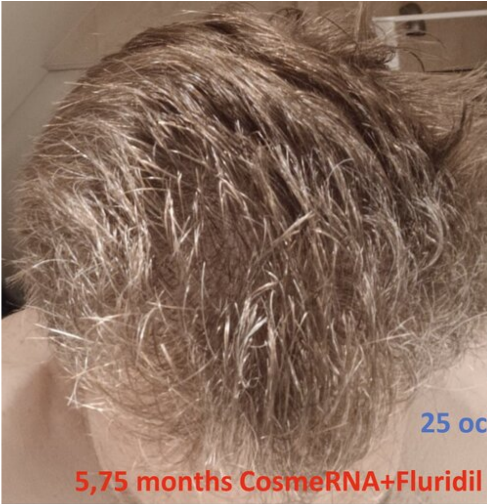
5,75 months CosmeRNA+Fluridil