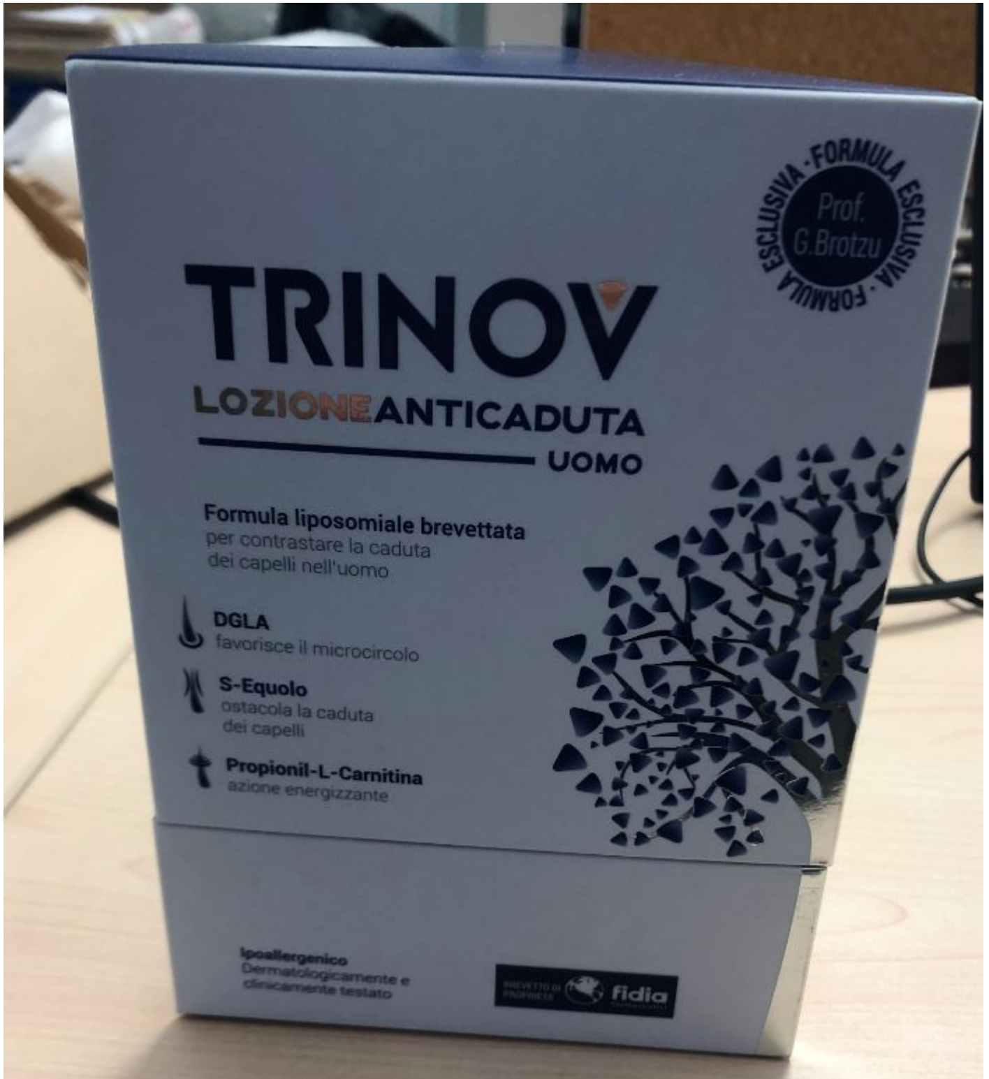
2) IMG_0216.JPG , downloaded 239 times