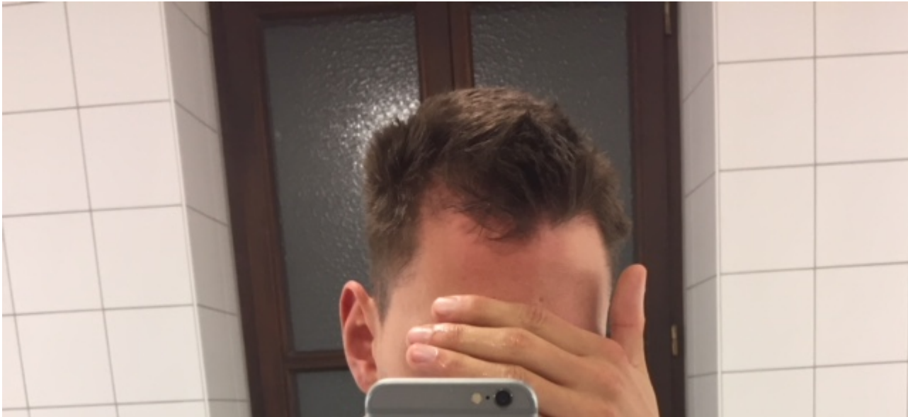
3) 3.JPG , downloaded 245 times