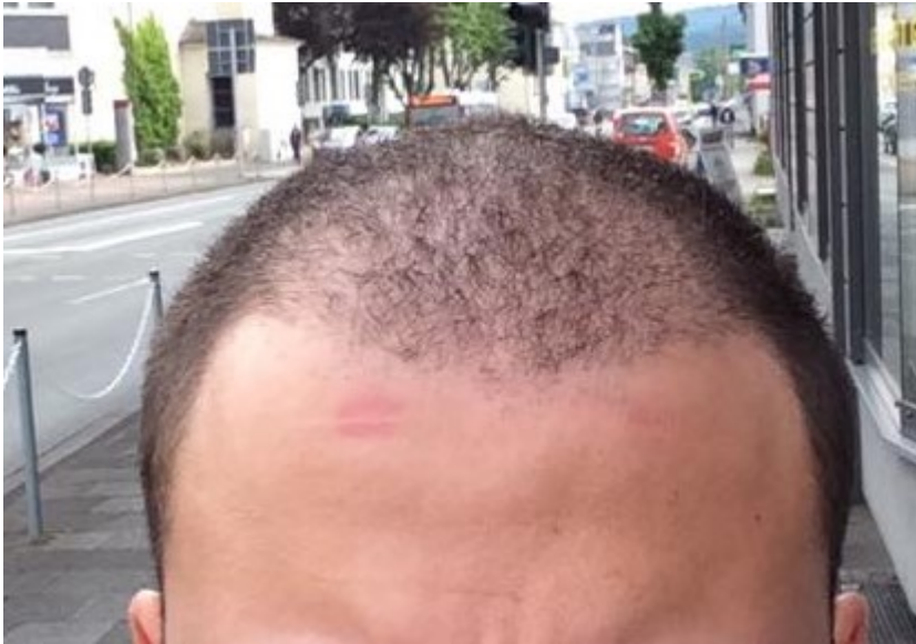
2) 11262939_852172521504366_1066212546_n.jpg , downloaded 326 times