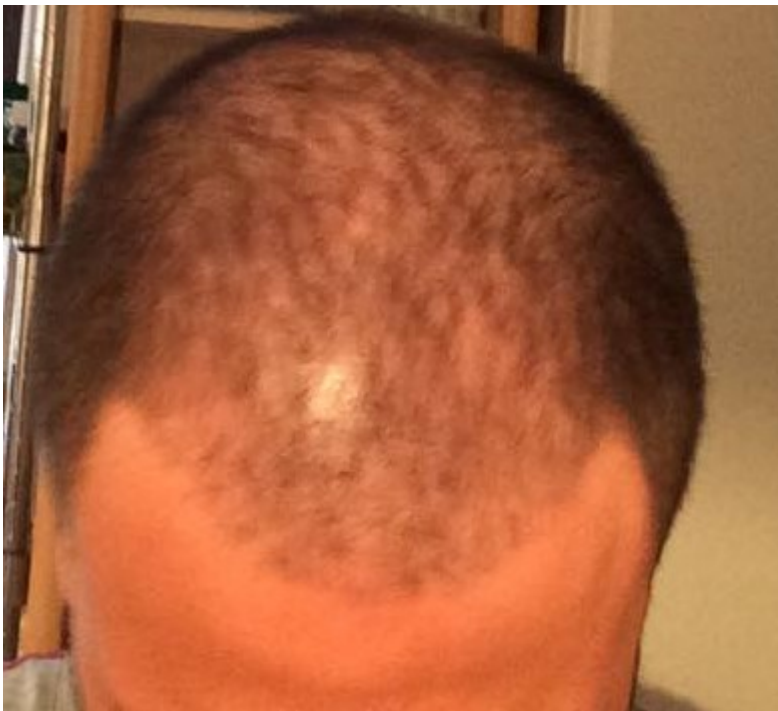
3) 11297755_852174341504184_1305390297_n.jpg , downloaded 303 times