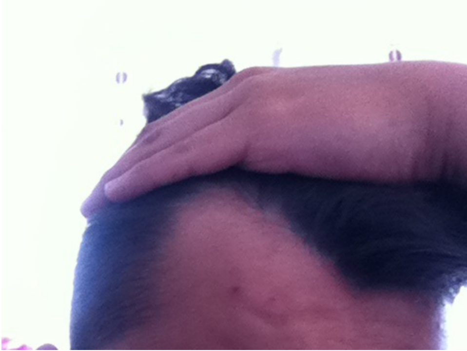
3) IMG_6789.JPG , downloaded 430 times