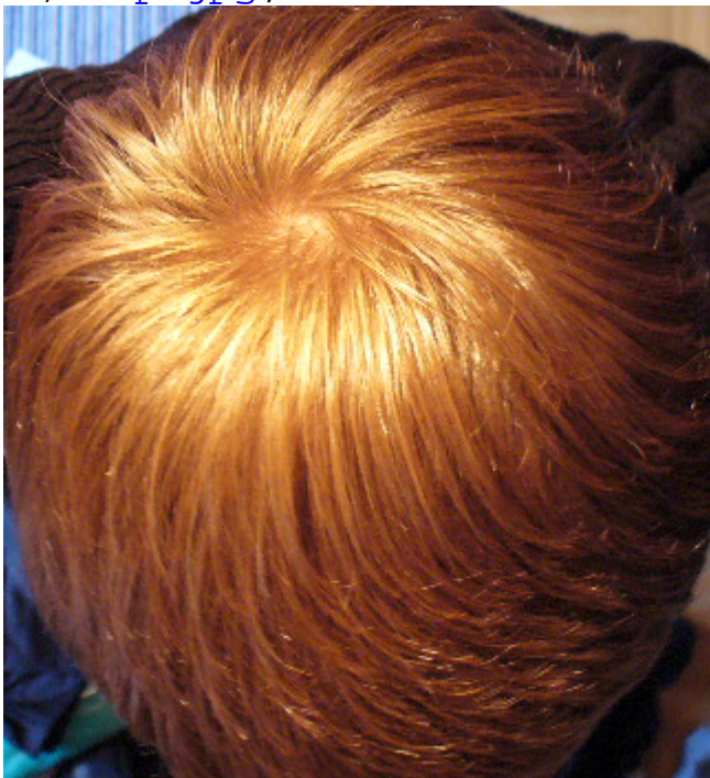
3) GHE.jpg , downloaded 347 times