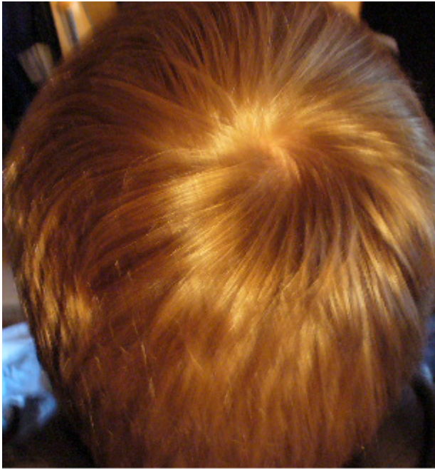
2) Top.jpg , downloaded 374 times