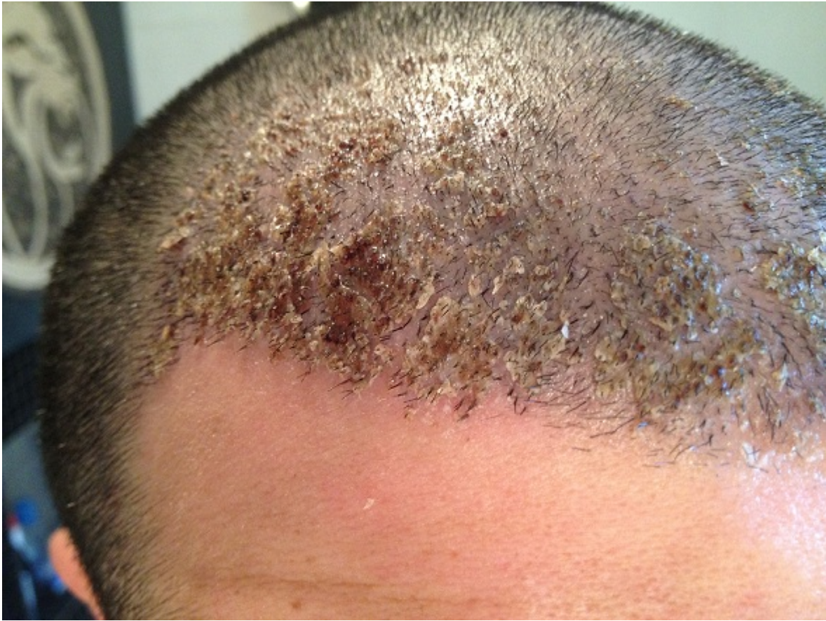
2) Tag 8 nach Wäsche links.jpg , downloaded 1168 times