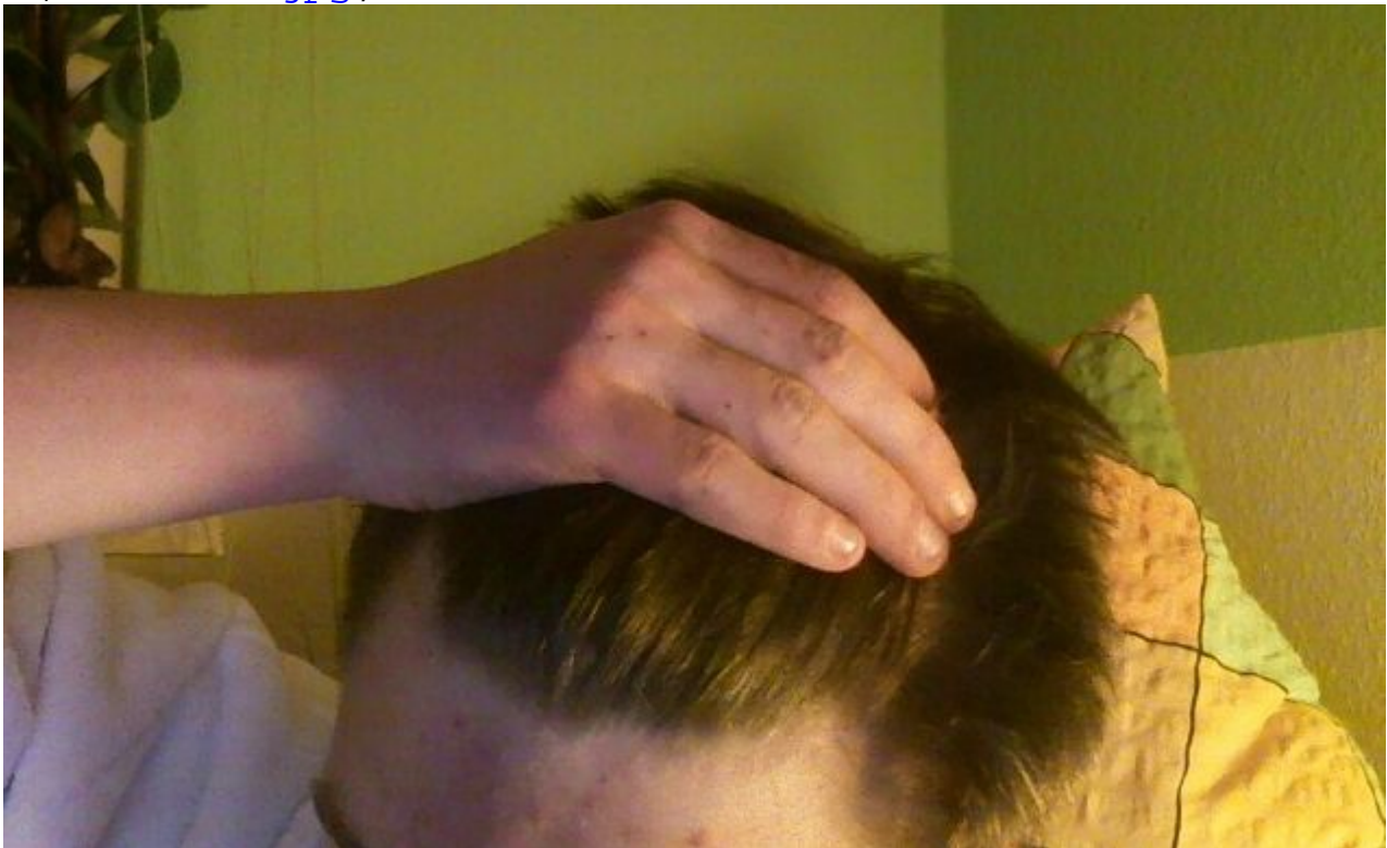
3) ansatz3.jpg , downloaded 245 times