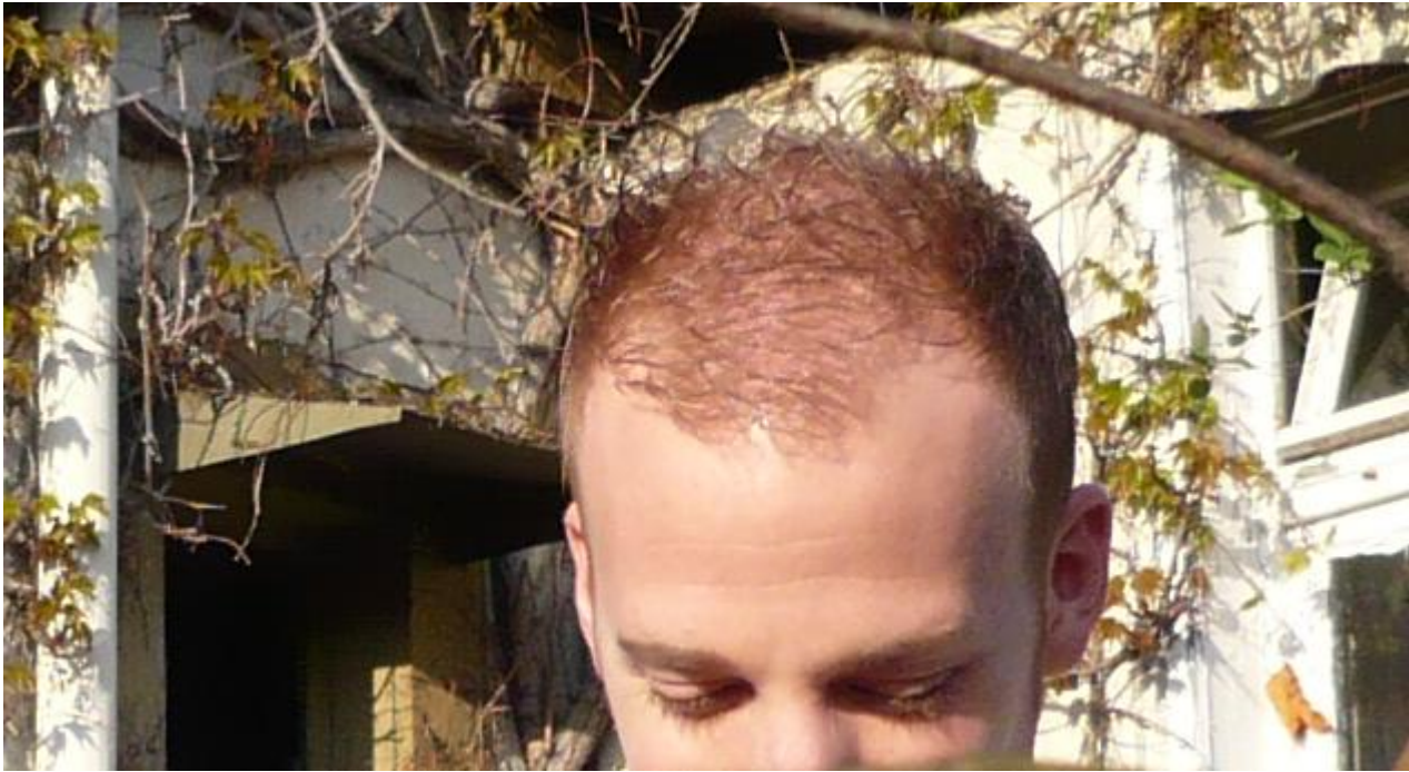
2) IMG_1922test222.jpg , downloaded 2469 times