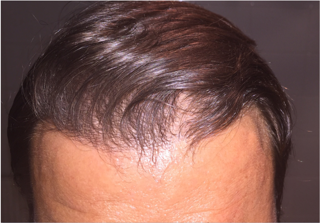
3) IMG_9404.png , downloaded 483 times