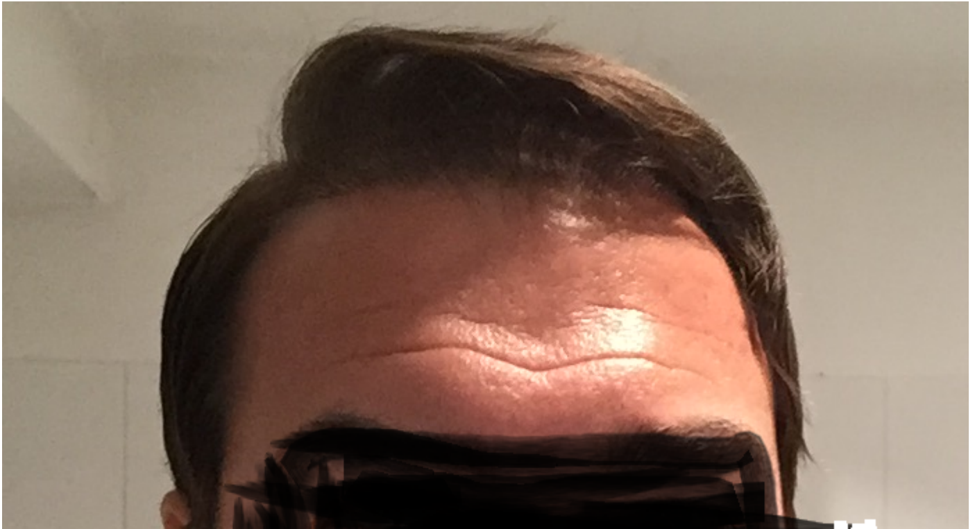
3) IMG_9410.png , downloaded 525 times