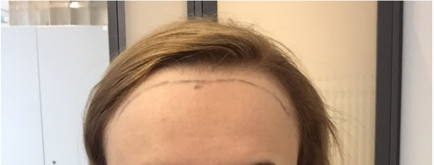
2) image.jpeg , downloaded 581 times