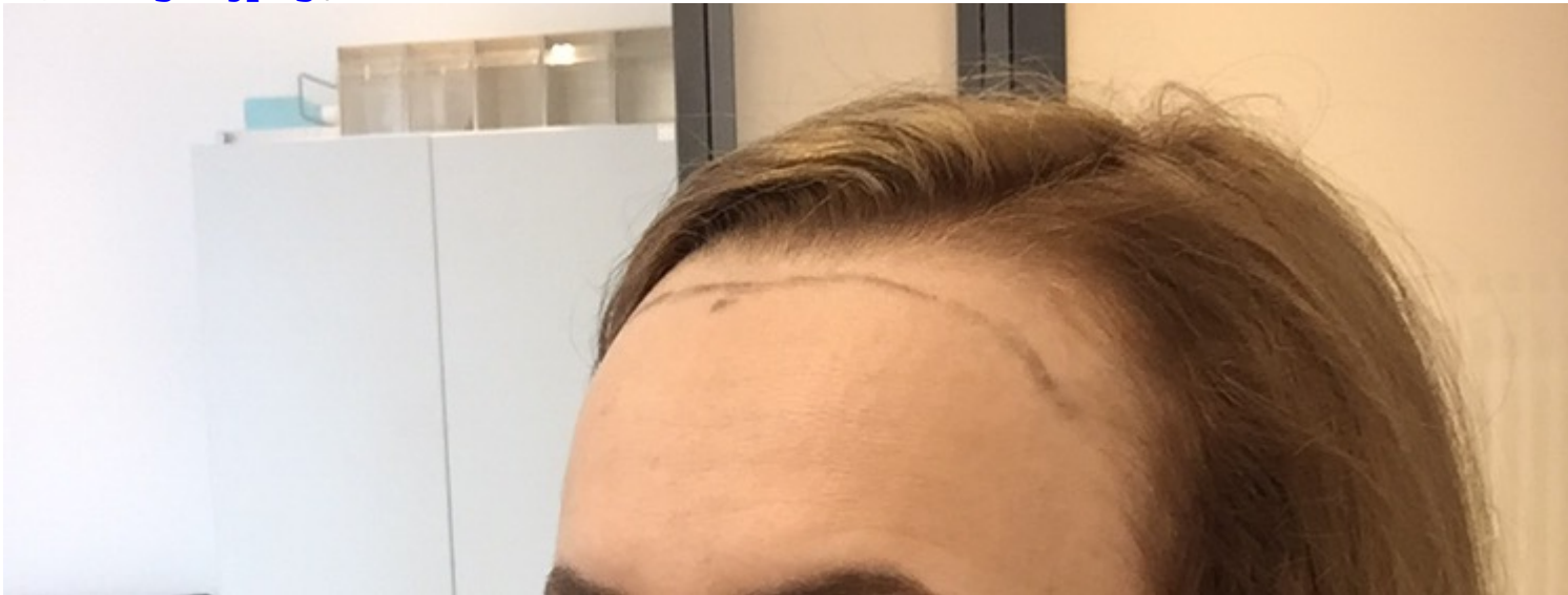
3) image.jpeg , downloaded 563 times