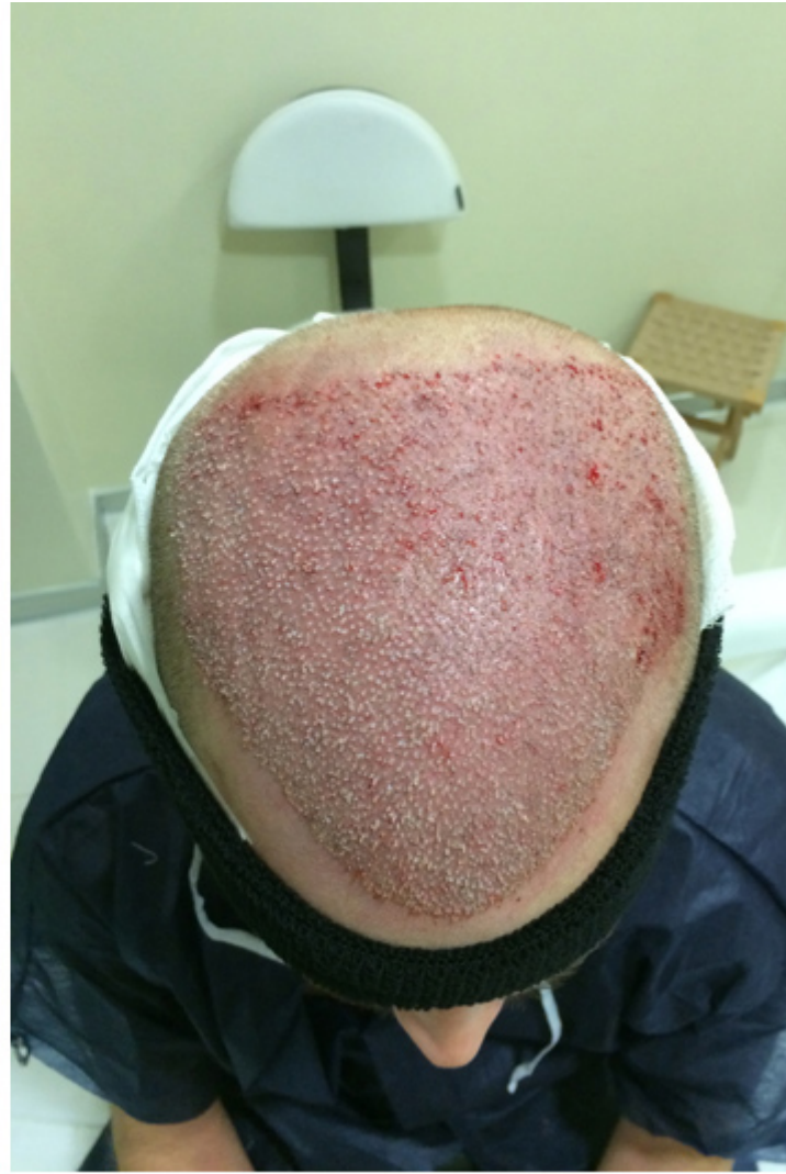
3) Oberkopf.jpg , downloaded 3293 times