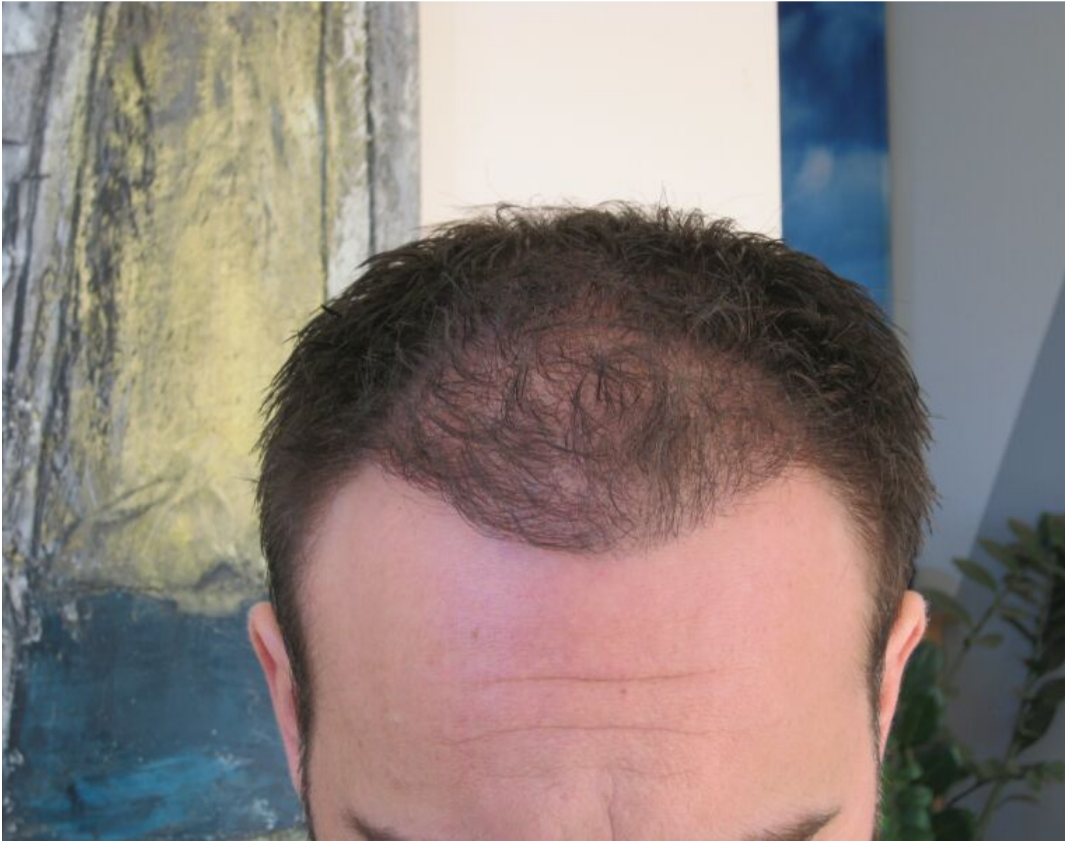
3) 4 Monate-02.jpg , downloaded 498 times