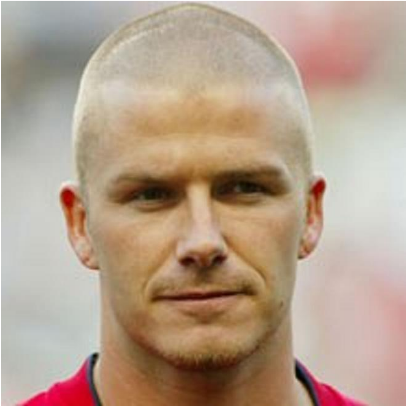
2) Brad Pit.jpg , downloaded 188 times