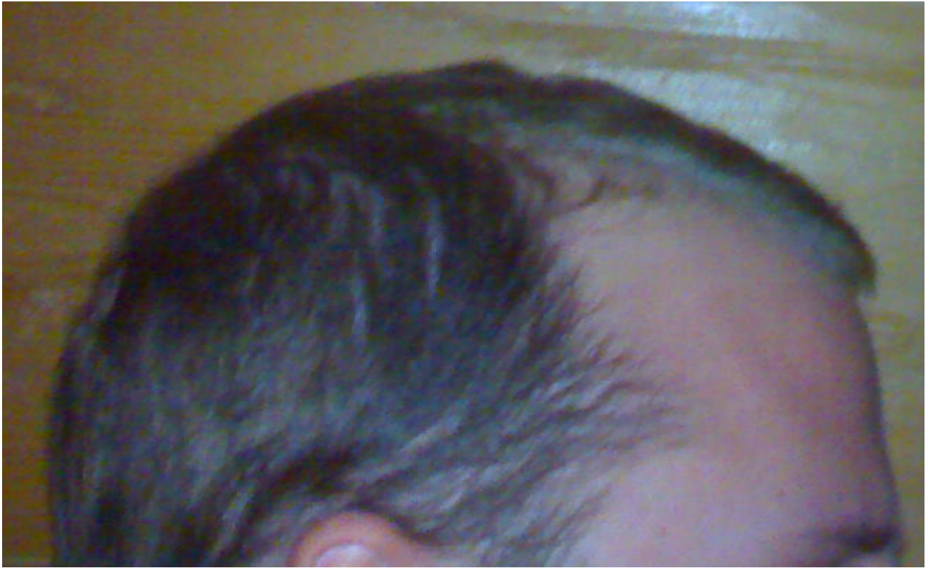
3) vorne.JPG , downloaded 289 times