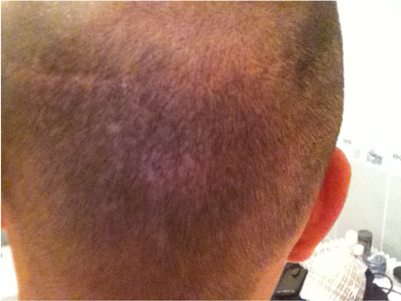
5) kurzhaar (81).JPG , downloaded 553 times