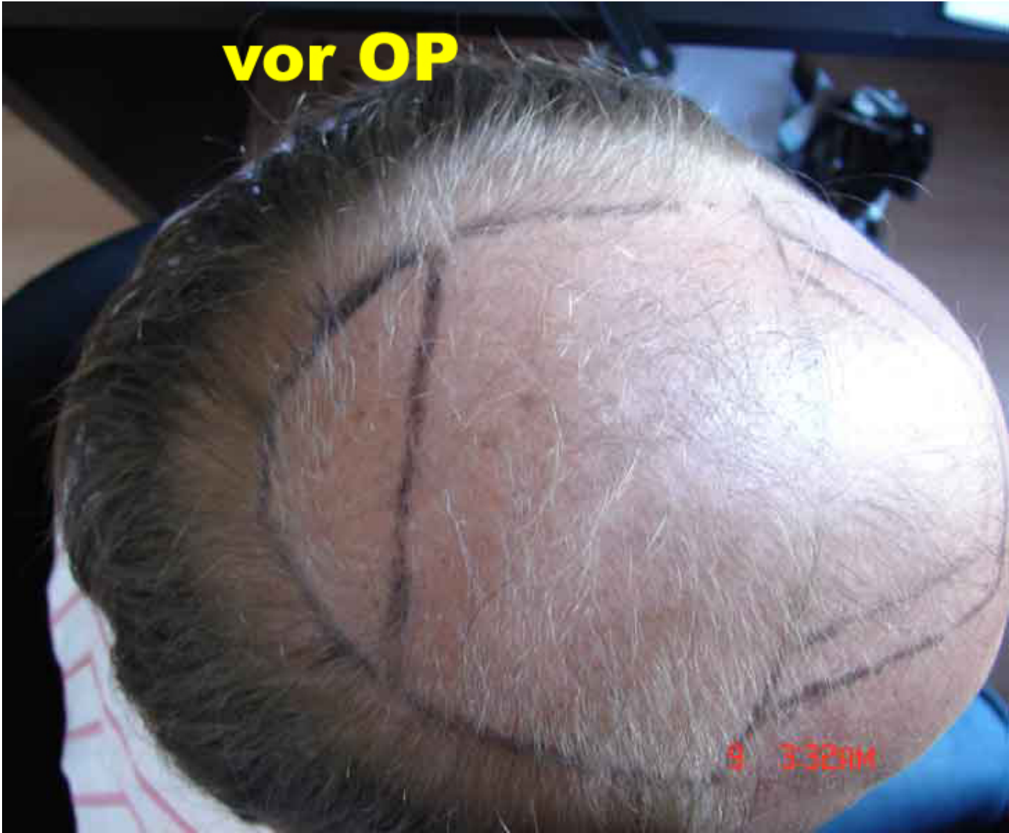
3) vor3.jpg , downloaded 106 times