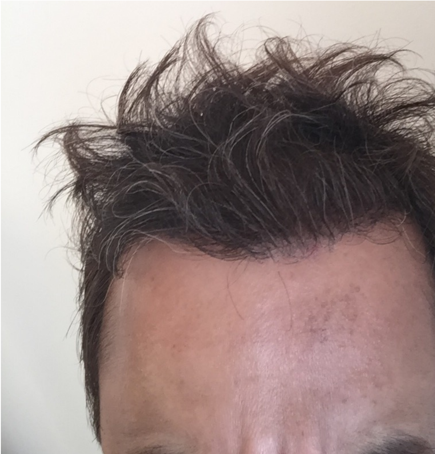
2) Front2_05Aug15.jpg , downloaded 709 times