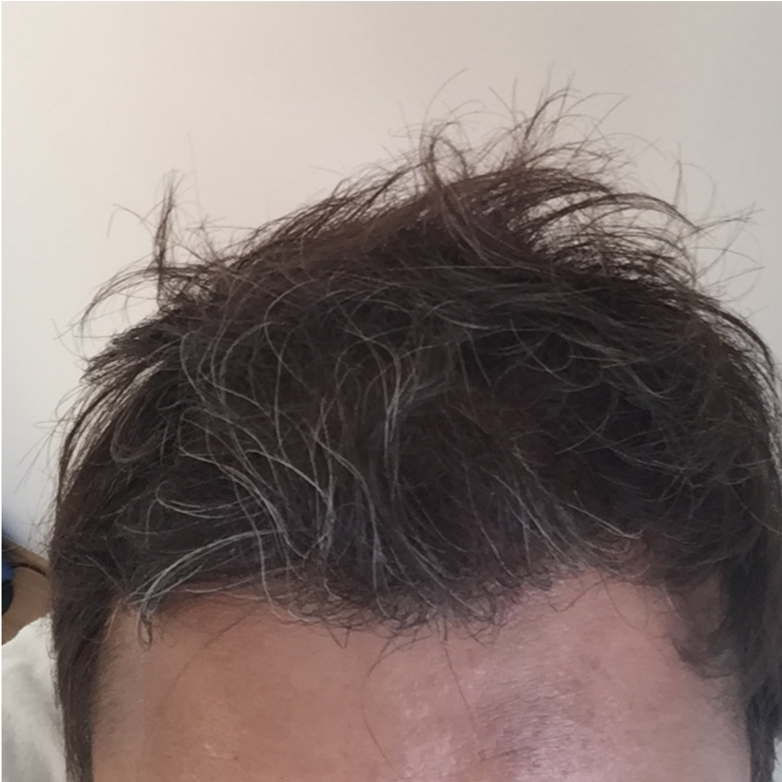
3) Front3_05Aug15.jpg , downloaded 674 times