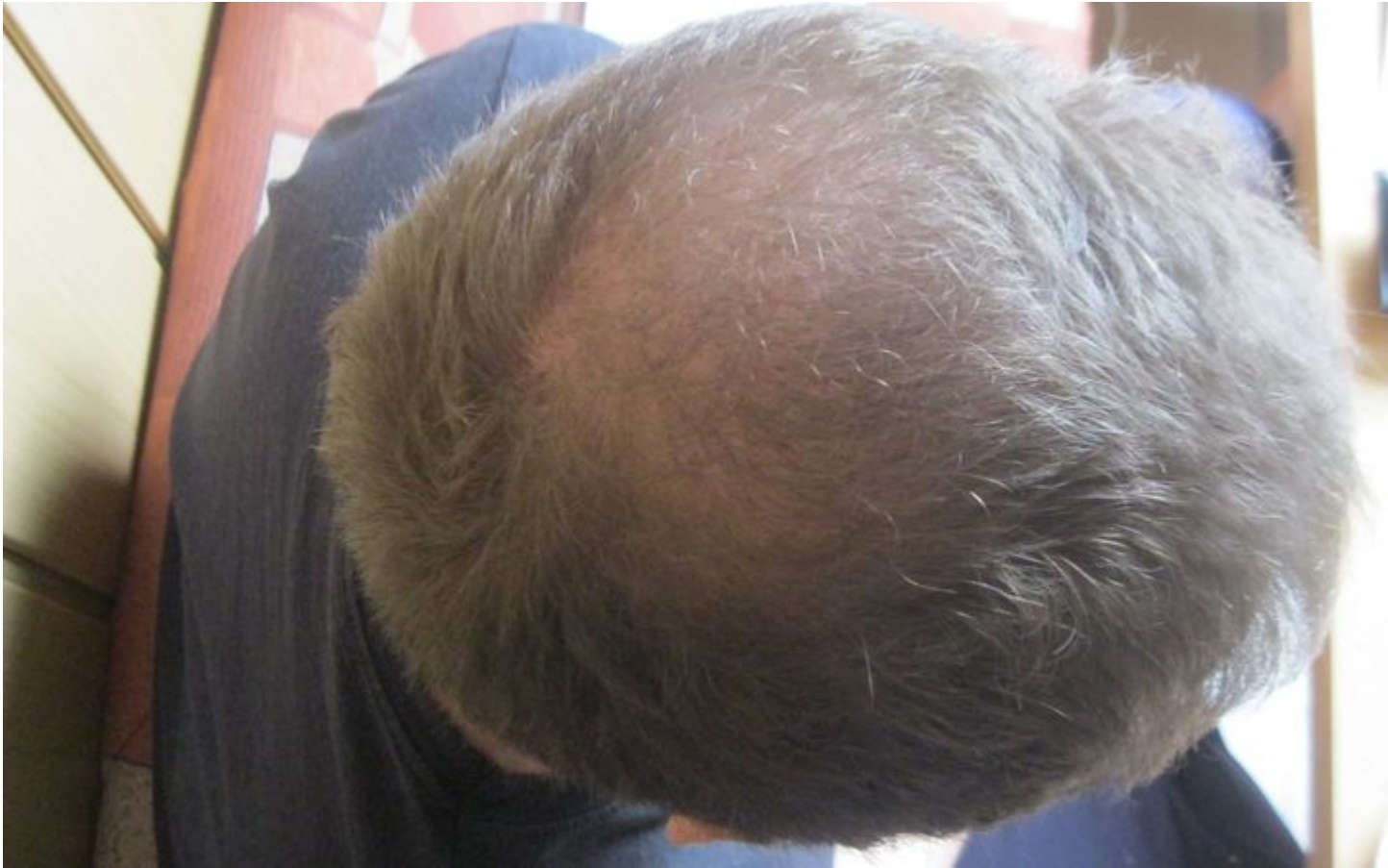
3) 6_monate_oben2.JPG , downloaded 748 times