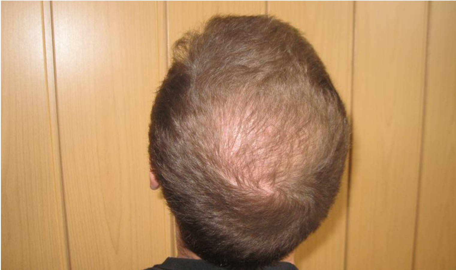
5) 6_monate_donor.JPG , downloaded 688 times