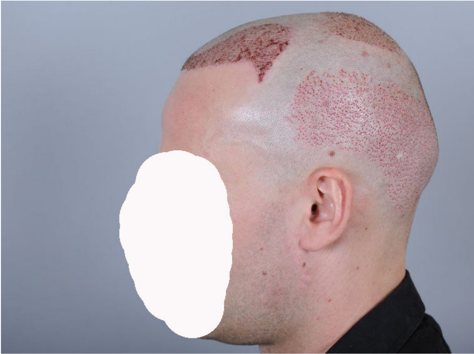
5) post_op2 Tag 1.JPG , downloaded 557 times