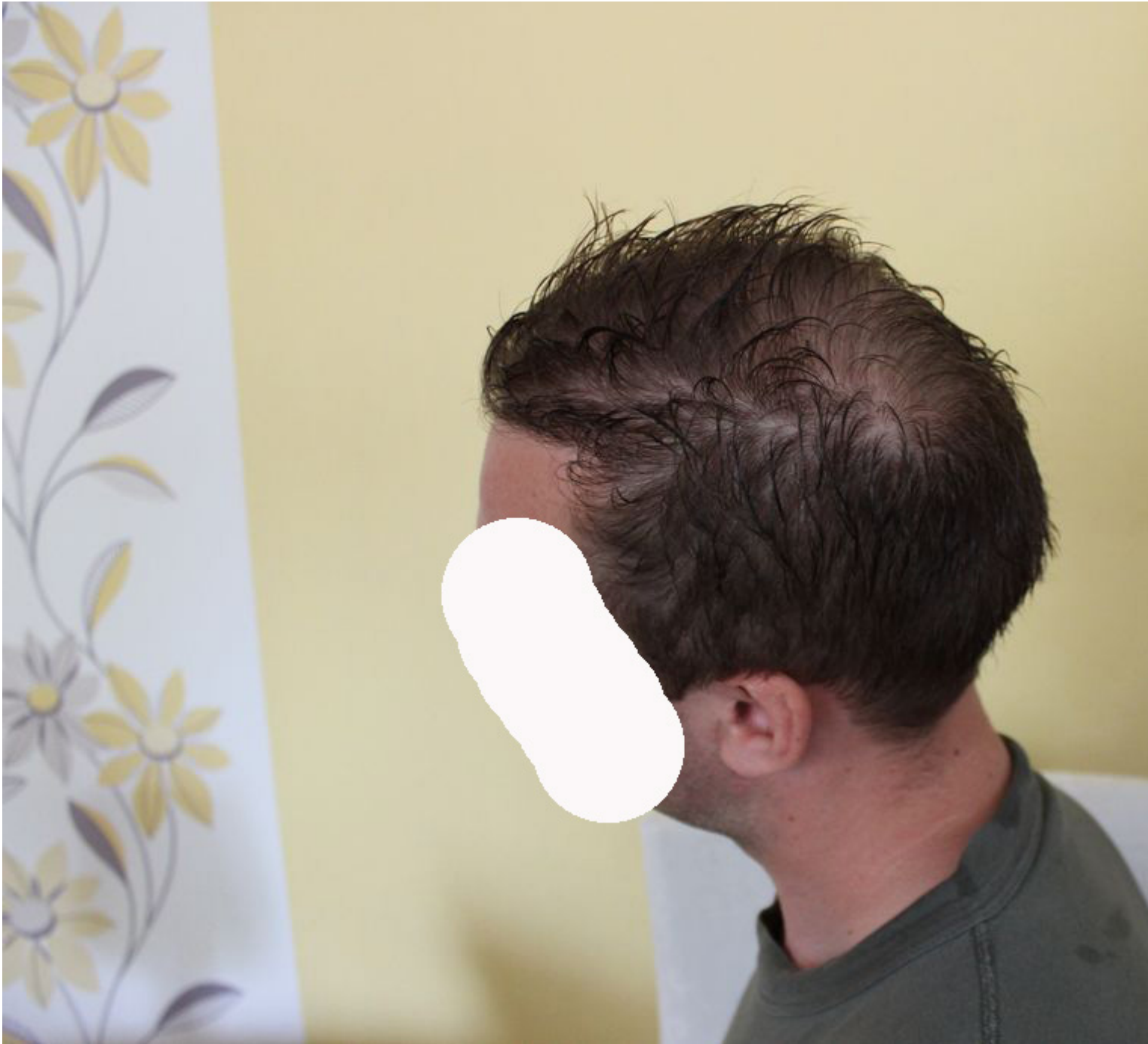
5) 12_monate_nass.jpg , downloaded 540 times