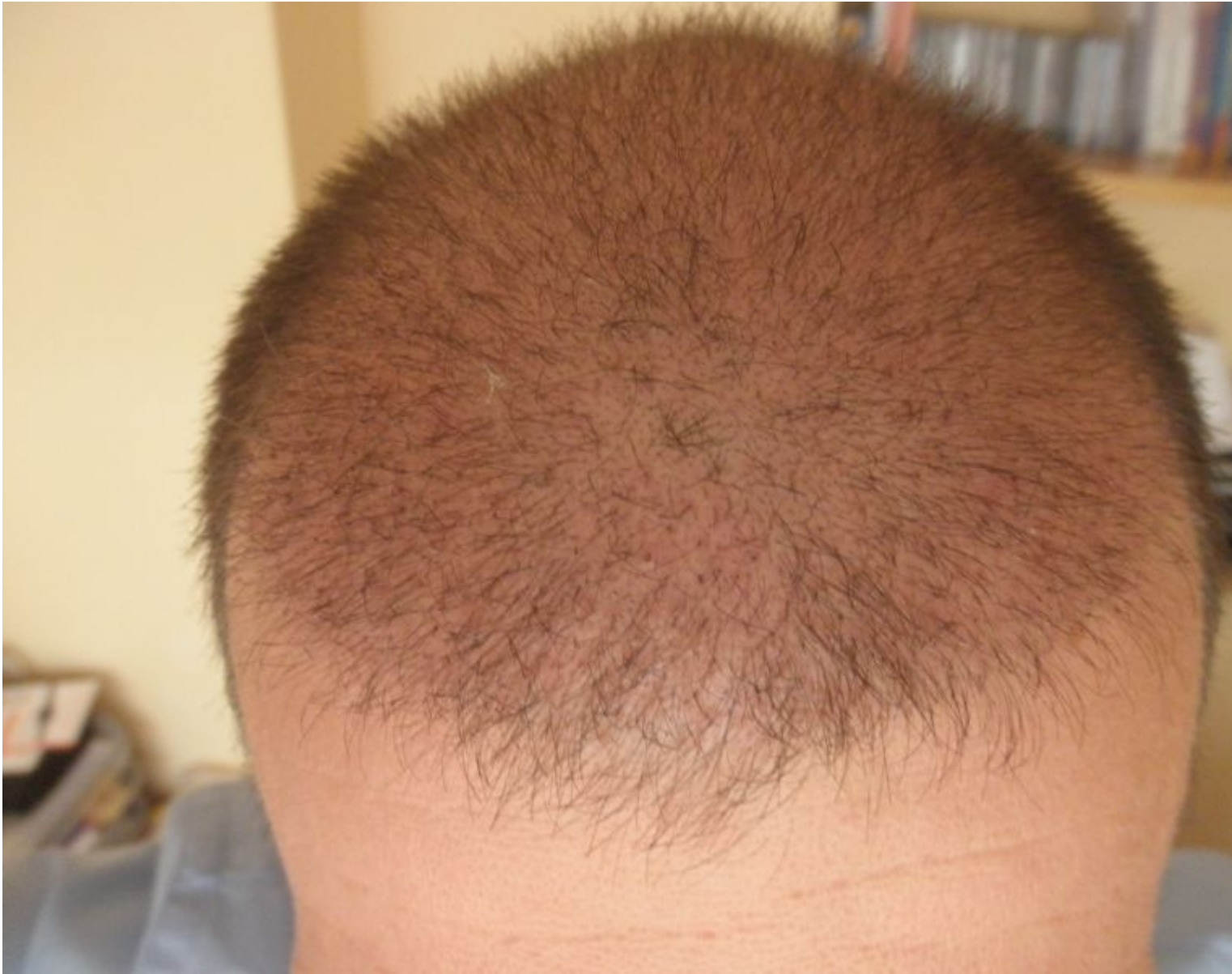
3) 24 Tage Post OP Tonsur.JPG , downloaded 315 times