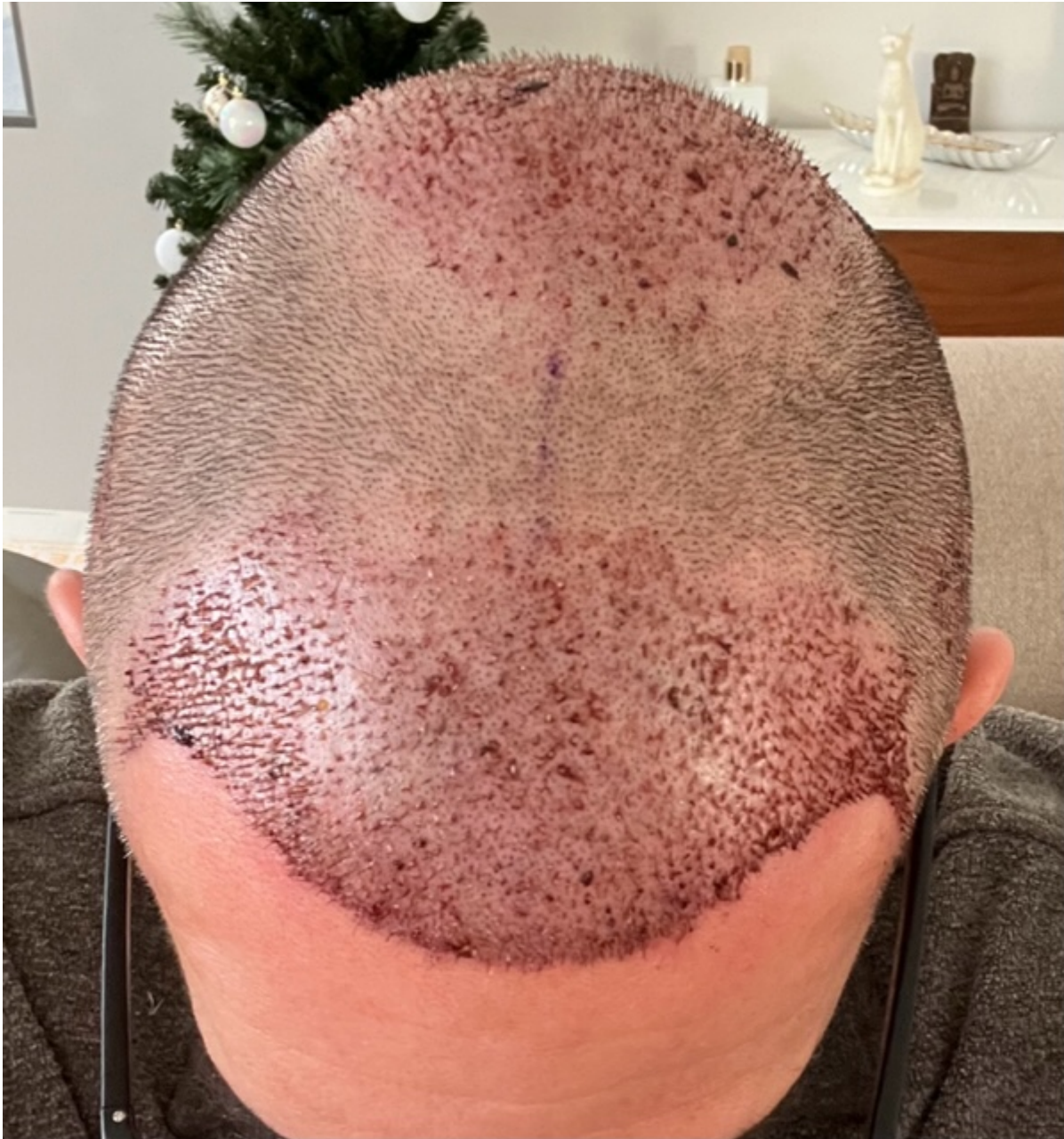
2) IMG_2260.jpg , downloaded 446 times