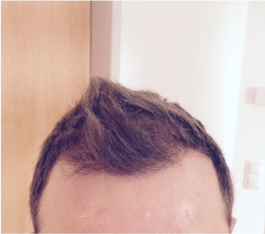
2) image.jpg , downloaded 452 times