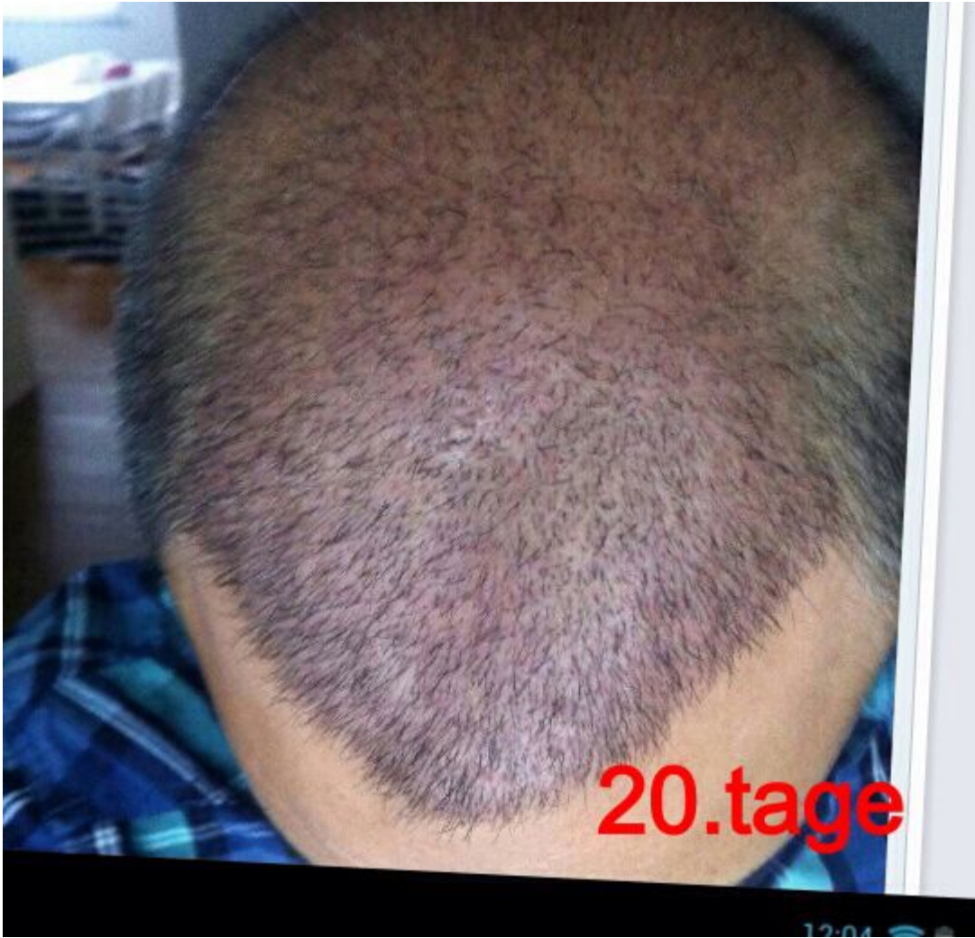
2) IMG-20140815-WA0011.jpg , downloaded 257 times