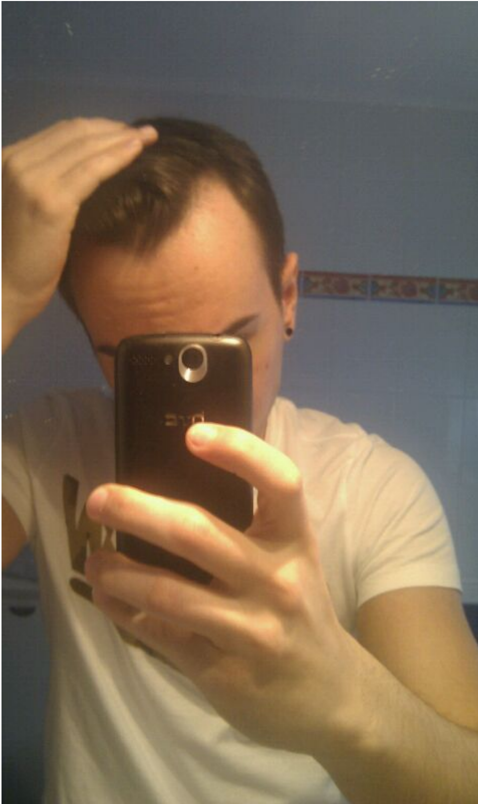
3) IMG-20140427-WA0026.jpg , downloaded 1190 times