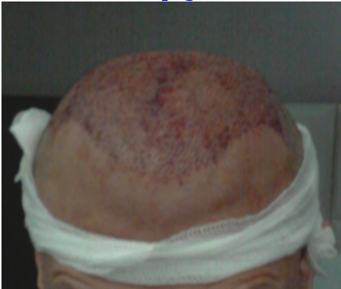
4) 3.Tag Post-OP Front.png , downloaded 2573 times