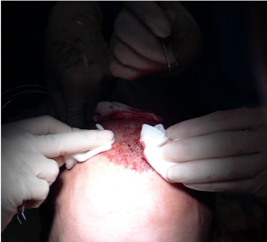
3) OP-VERBAND.png , downloaded 1599 times