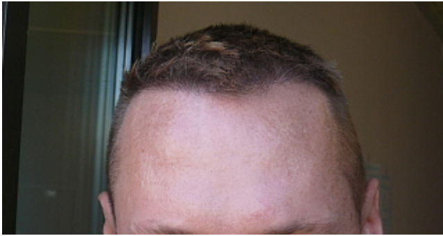
2) 19.Wo post3.jpg , downloaded 3048 times