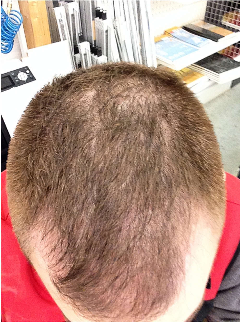
2) 500x667-IMG_0838.JPG , downloaded 807 times