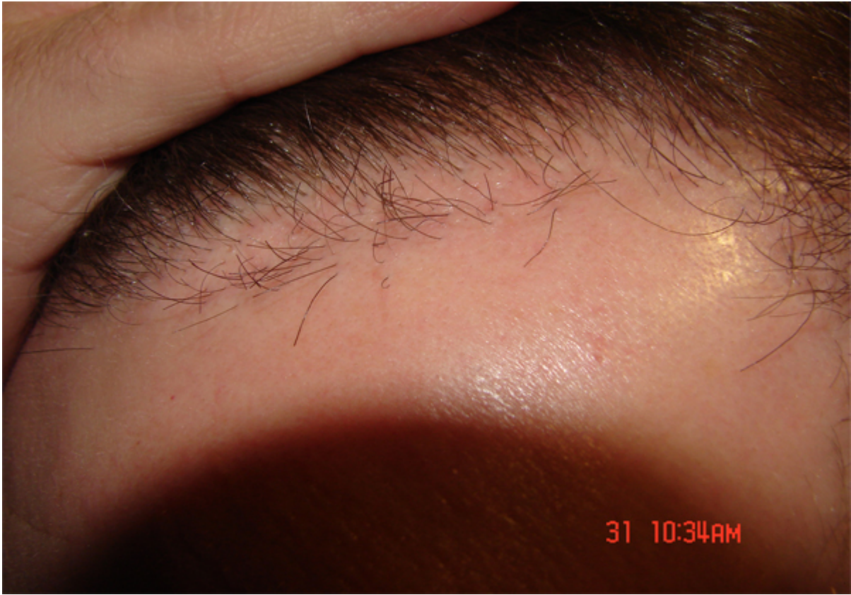
3) res.jpg , downloaded 1187 times