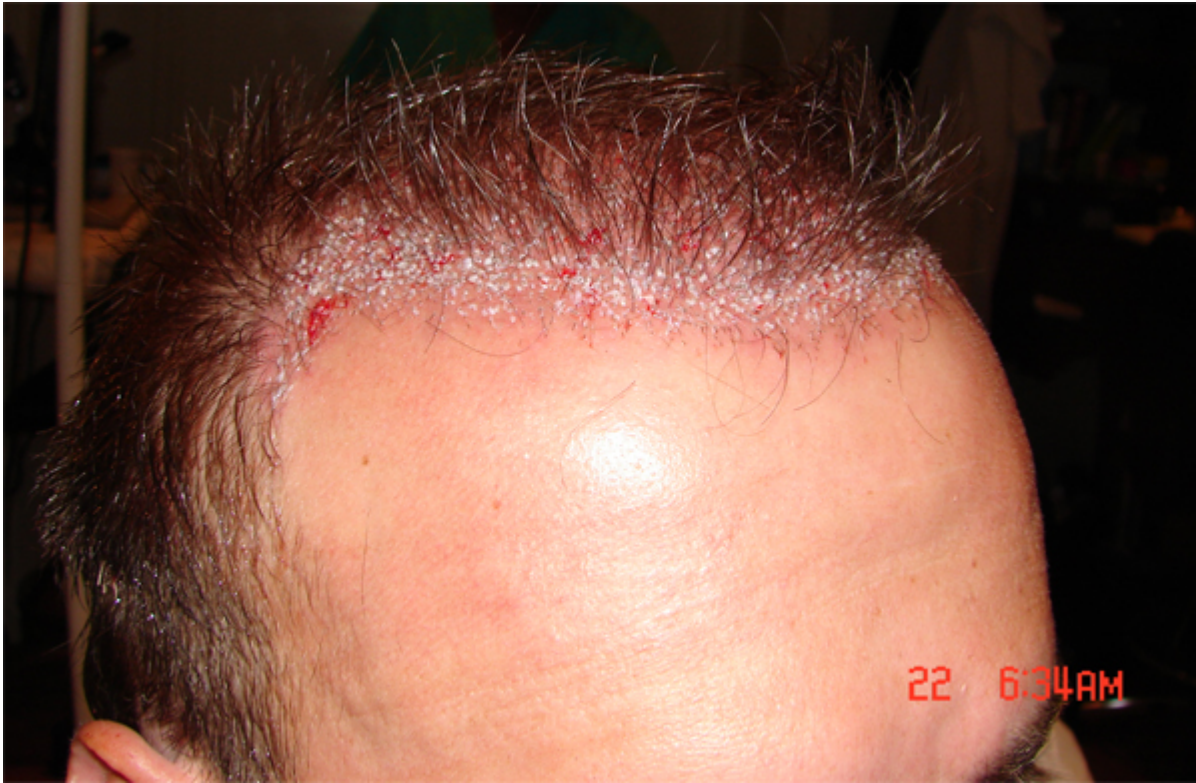
2) direkt_.jpg , downloaded 1345 times