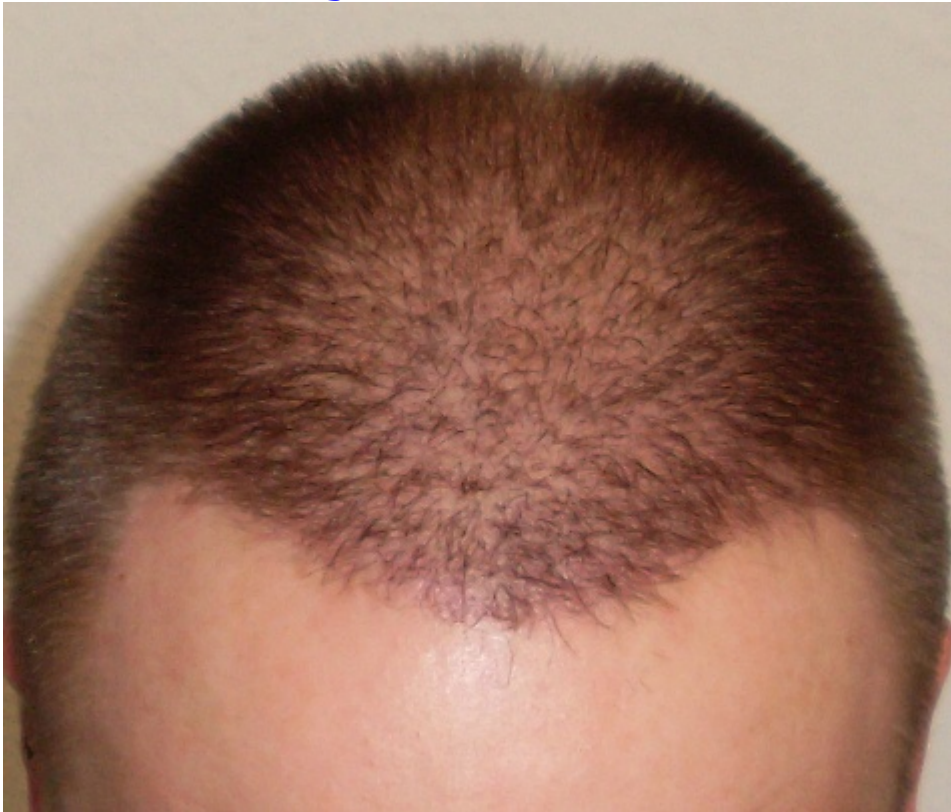
5) Tonsur.JPG , downloaded 1575 times