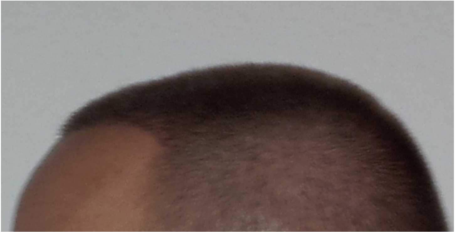
4) 20121023_182759.jpg , downloaded 1753 times