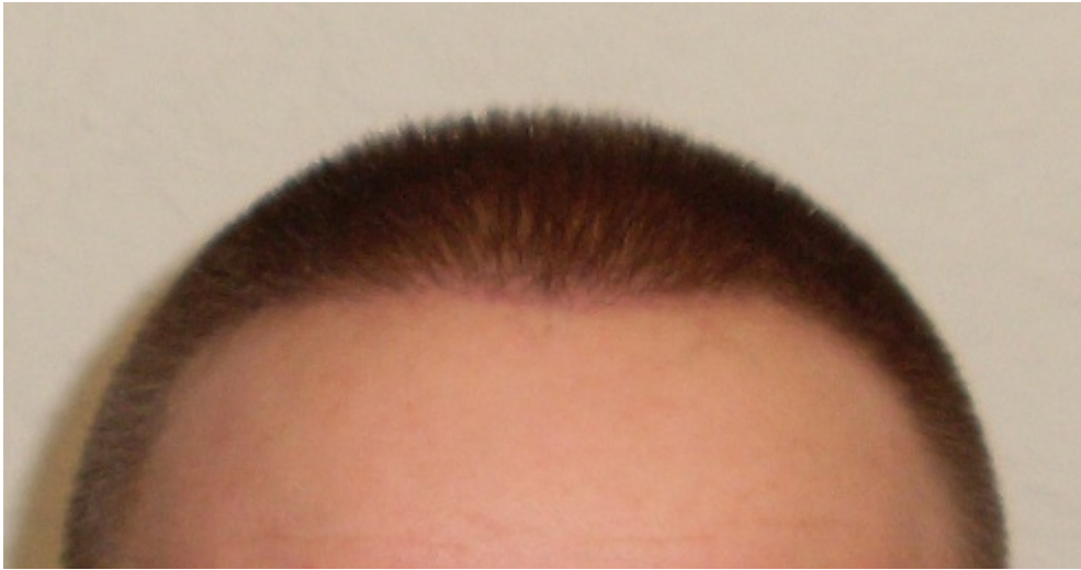
4) Vorne schräg.JPG , downloaded 1577 times