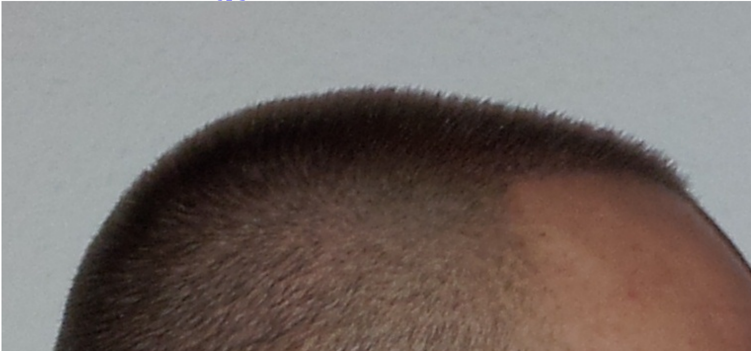
5) 20121023_182817.jpg , downloaded 1835 times