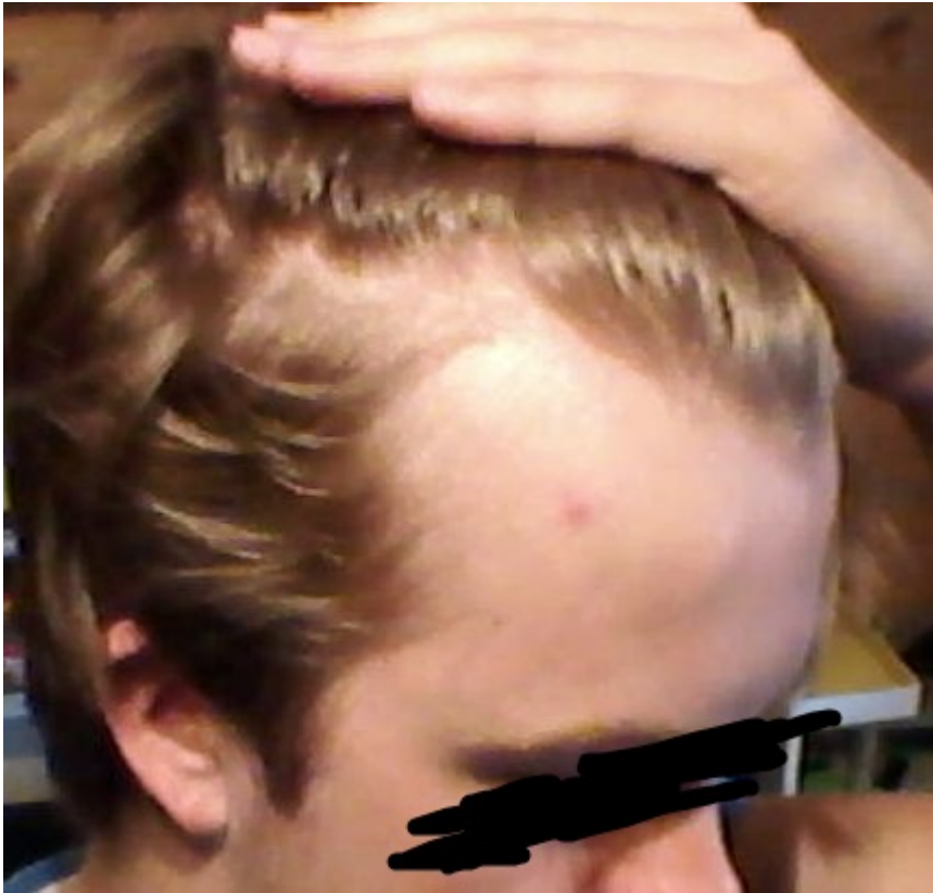
3) 2012-05-31 10.22.34.jpg , downloaded 382 times