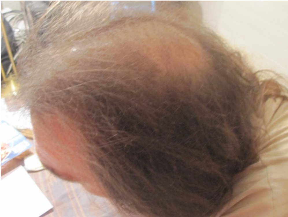
2) platte1.jpg , downloaded 389 times