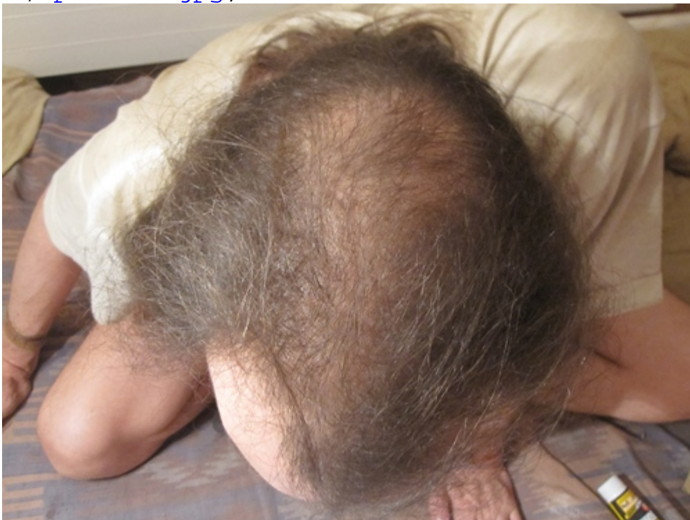
3) platte2.jpg , downloaded 368 times