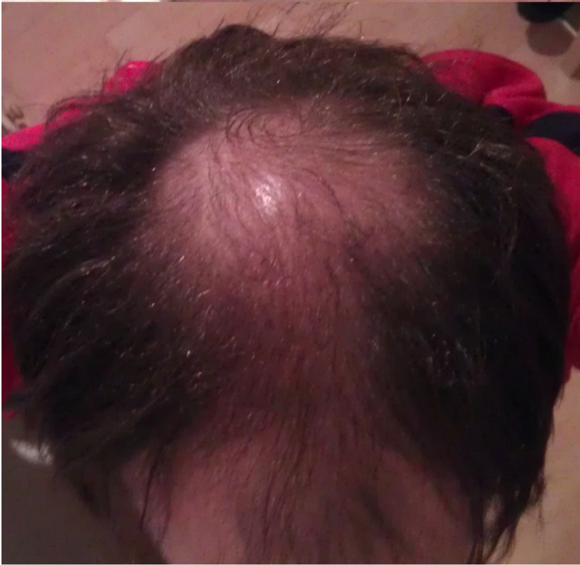
2) 2.jpg , downloaded 829 times