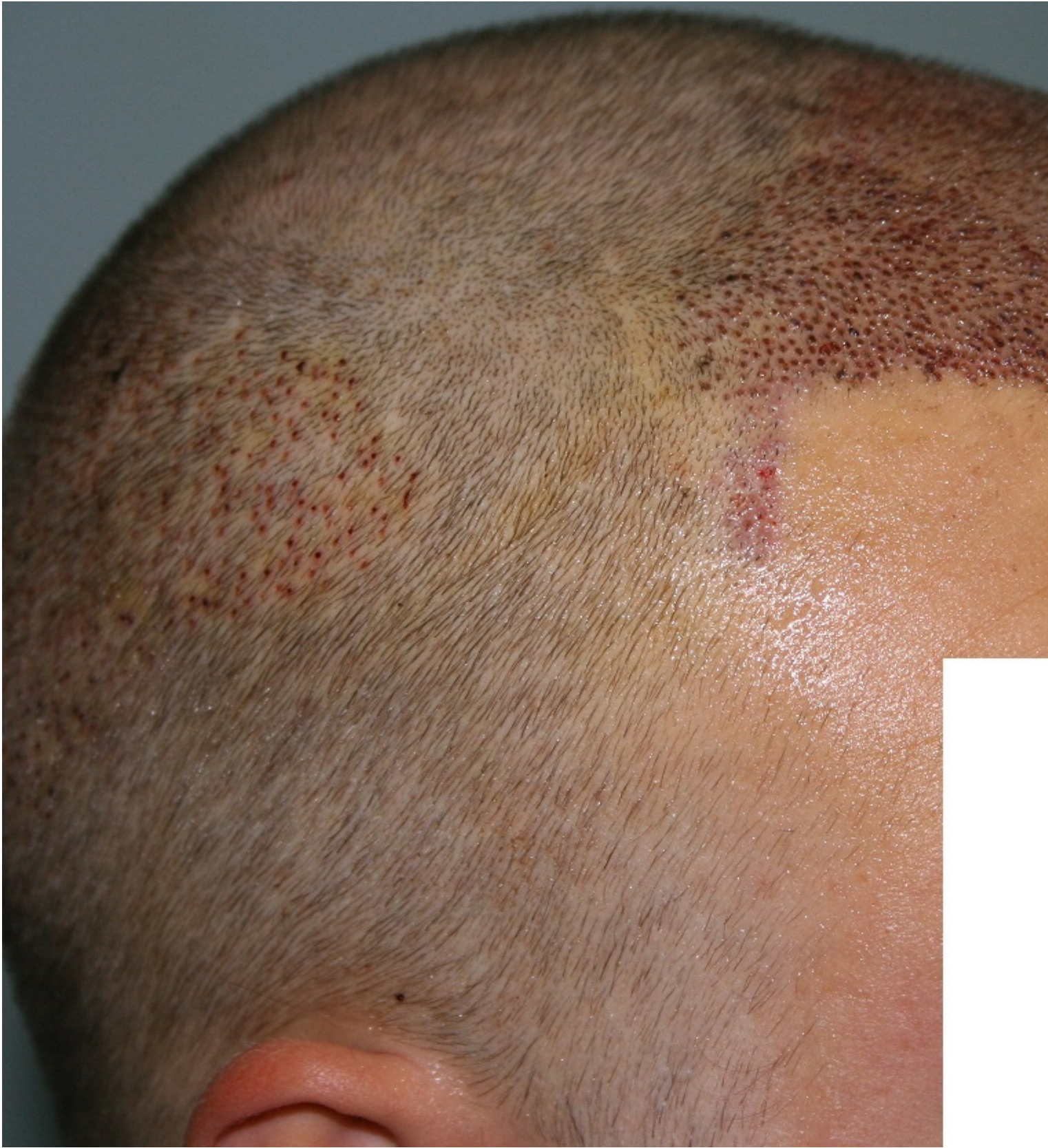
2) Post OP.jpg , downloaded 1969 times