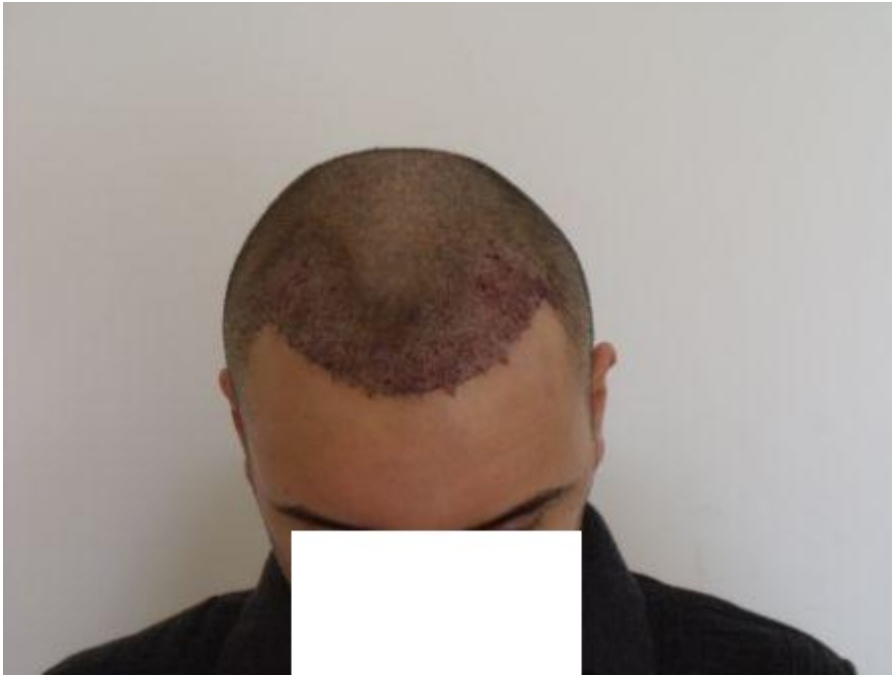
3) PreOp-3.JPG , downloaded 568 times