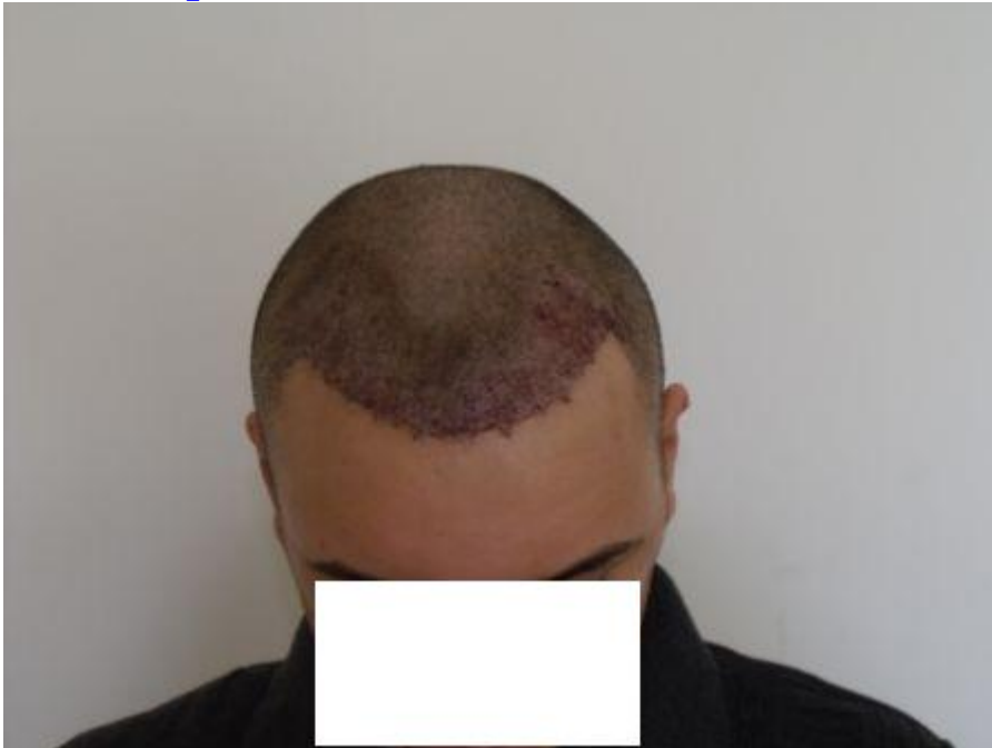
4) PreOp-4.JPG , downloaded 570 times