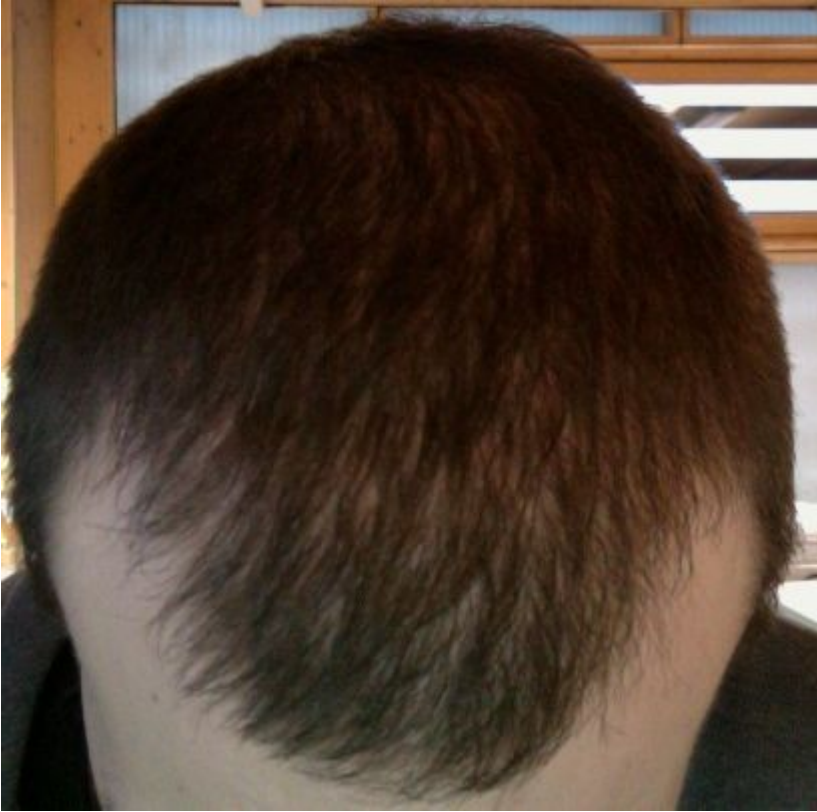
2) von oben Tageslicht1.jpg , downloaded 488 times