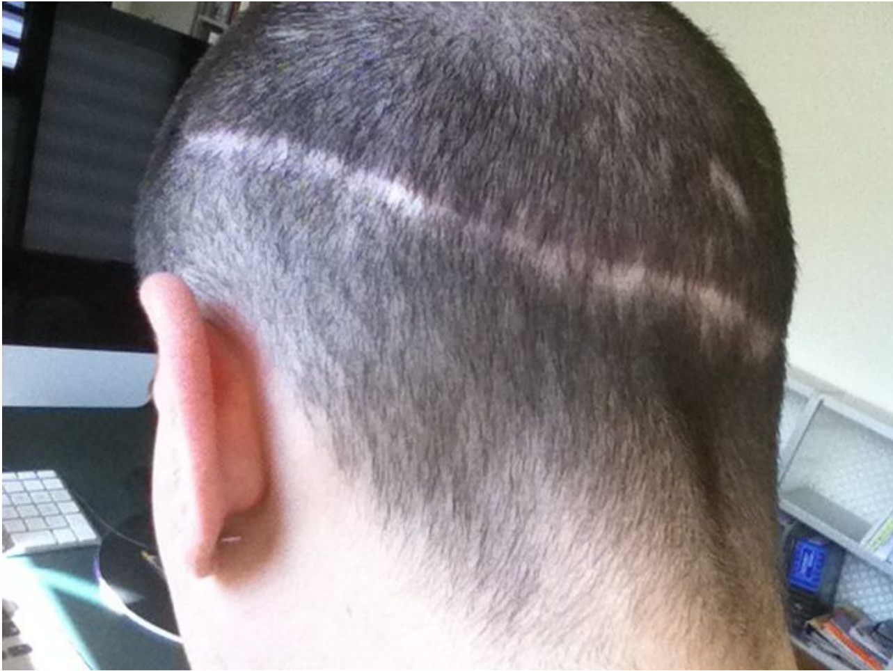
4) von hinten.jpg , downloaded 450 times