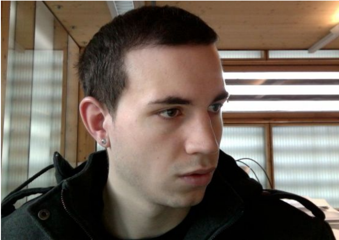
2) Narbe.jpg , downloaded 528 times