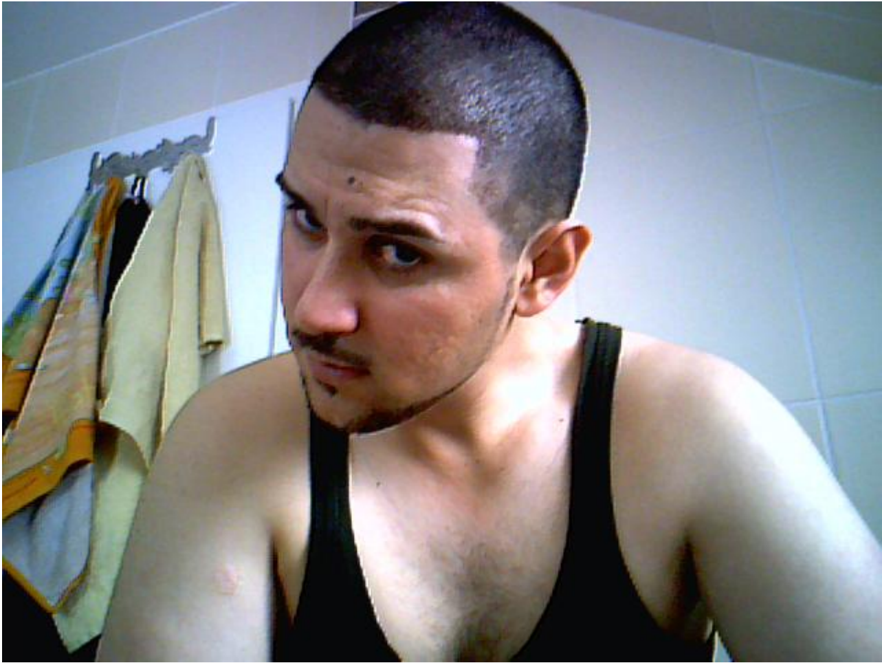
2) Bild 021.jpg , downloaded 639 times