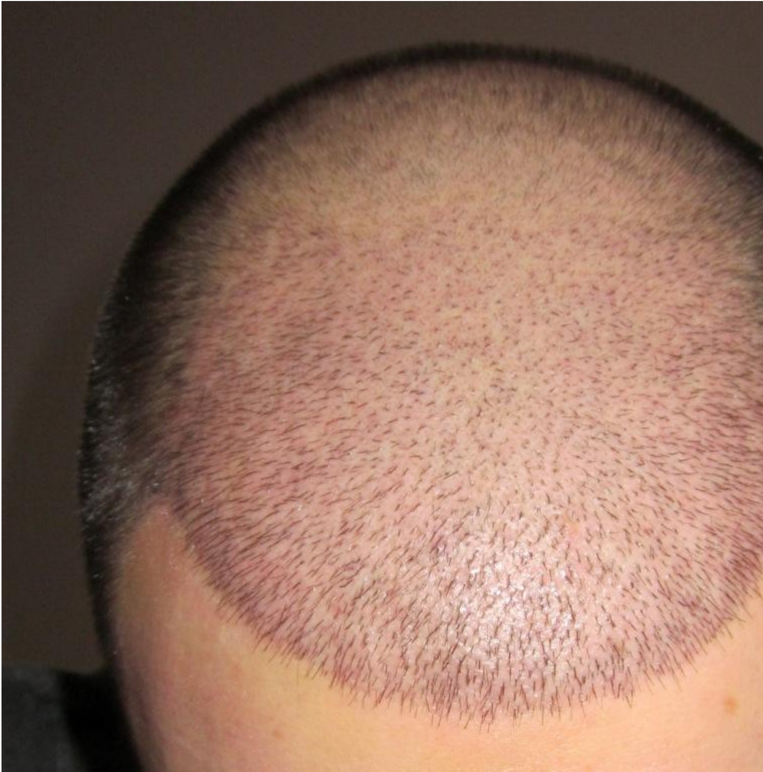
2) IMG_0368.JPG , downloaded 674 times