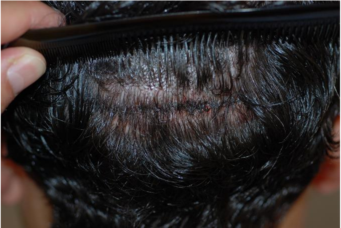
2) narbe-1-tag-post-op2.JPG , downloaded 398 times