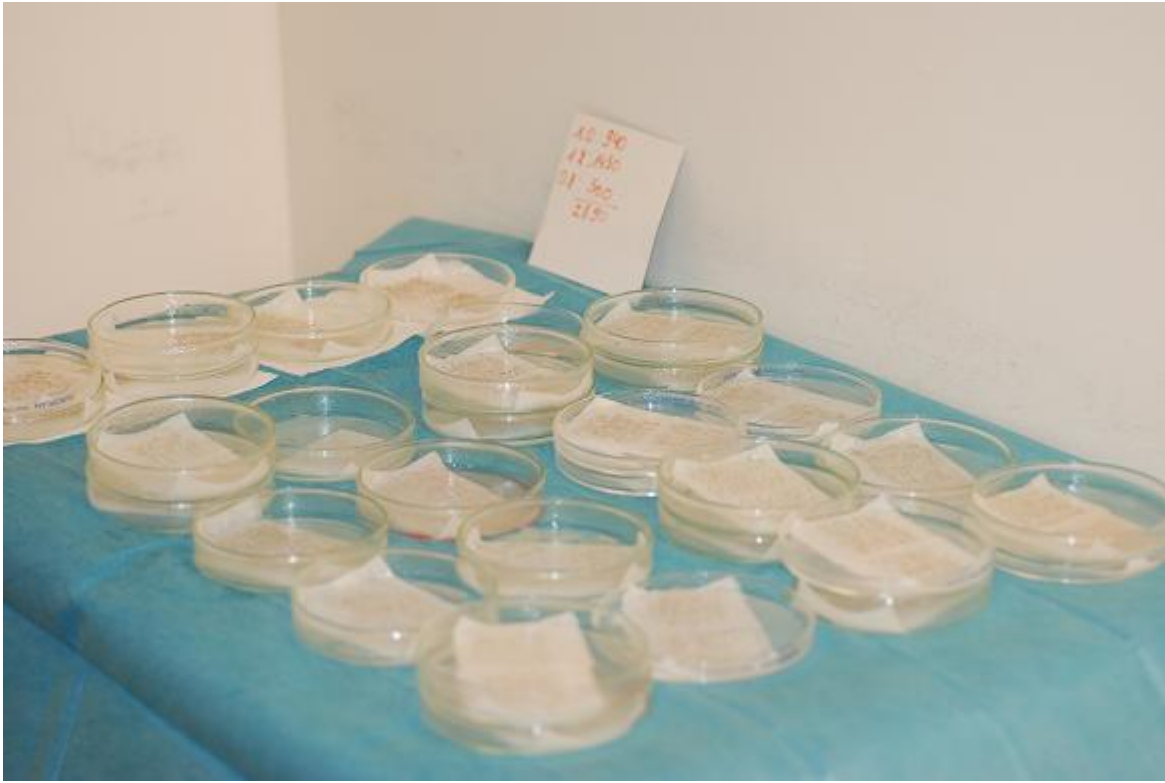
2) dichtemessung.JPG , downloaded 2273 times