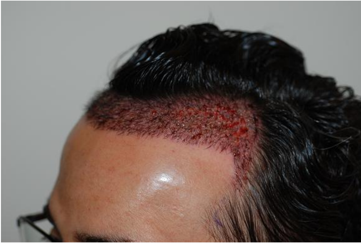
2) post-op-rechts.JPG , downloaded 2243 times