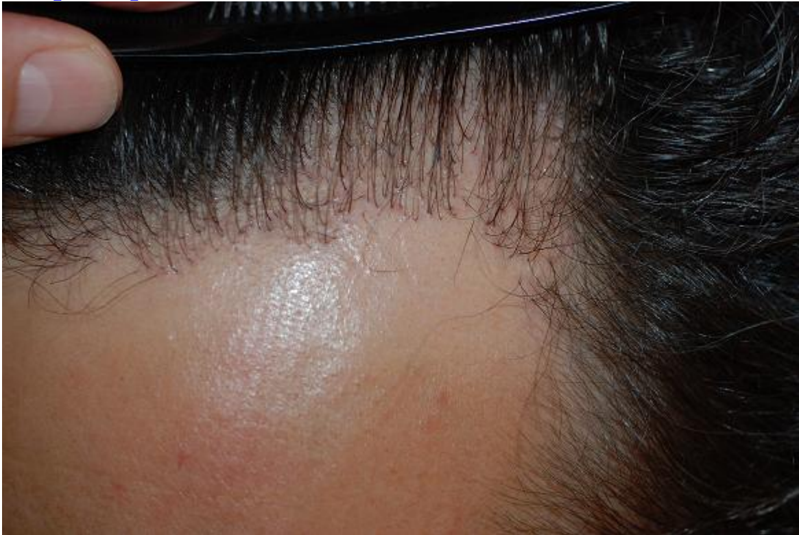
3) pre-op-rechts.JPG , downloaded 3356 times