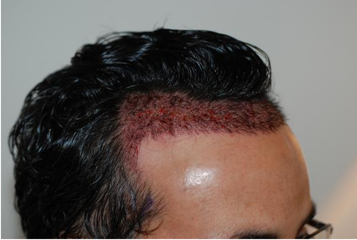
3) haarlinie-post-op-von-oben.JPG , downloaded 2262 times