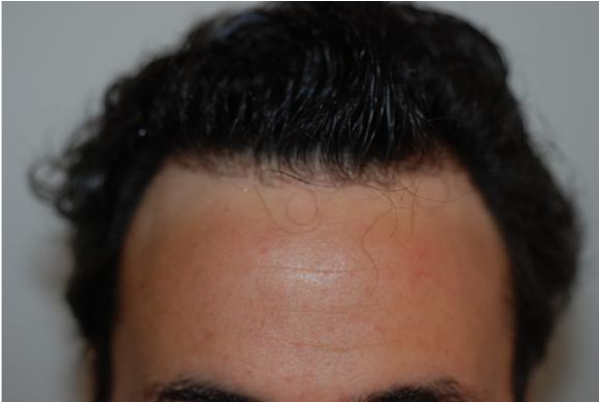
2) pre-op-links.JPG , downloaded 3370 times