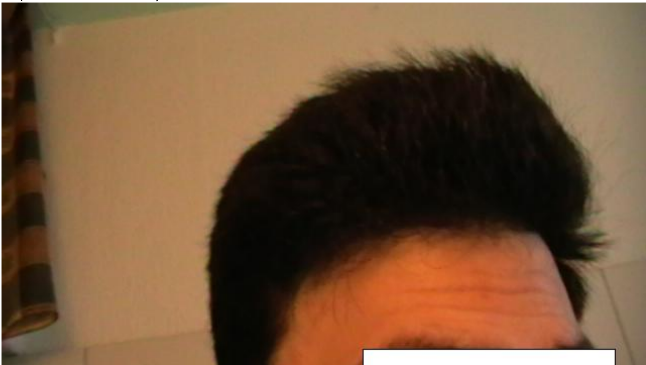
3) 7mhtt3.JPG , downloaded 275 times