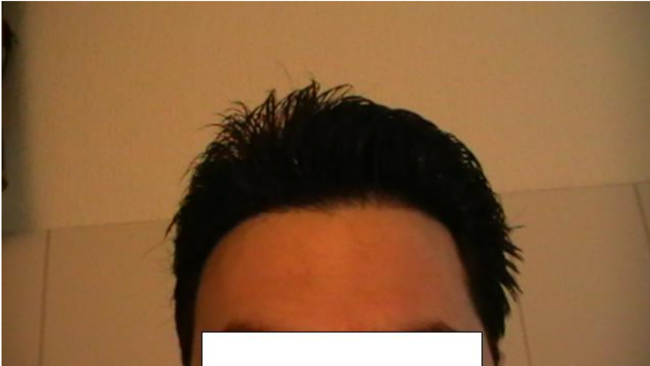
2) 7mwet2.JPG , downloaded 209 times