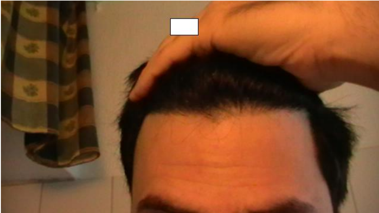
2) 7mhtt2.JPG , downloaded 271 times