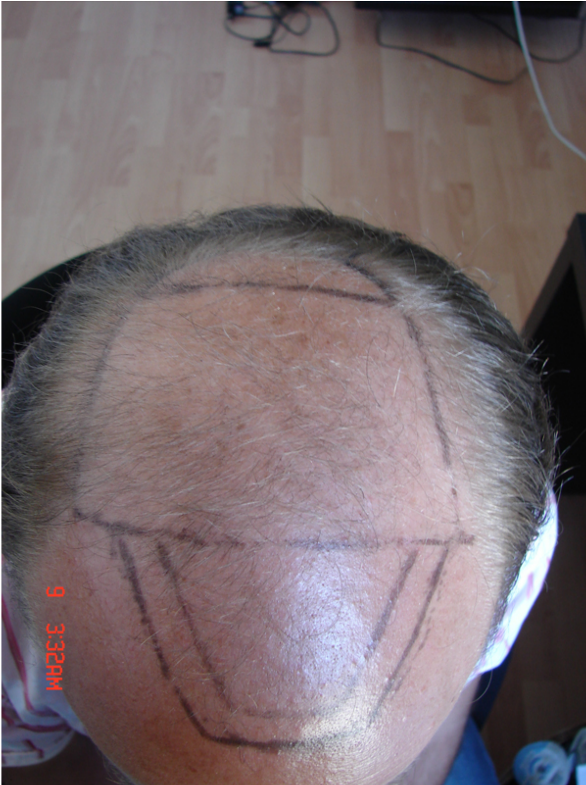
3) Ausgangslage.jpg , downloaded 555 times