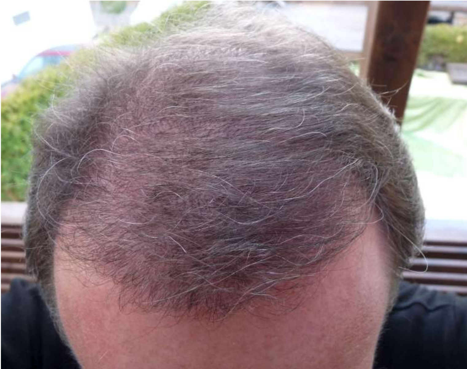
2) 5.Monat a-W800.jpg , downloaded 413 times