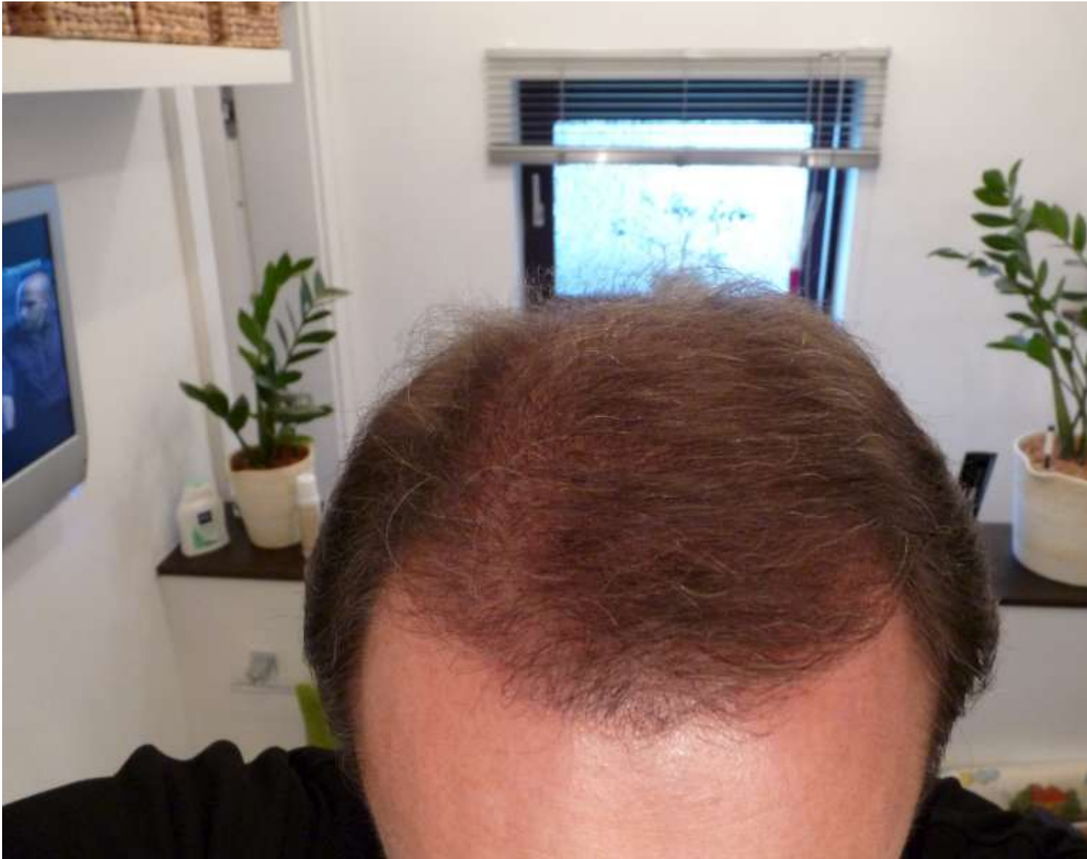
2) 5.Monat s-W800.jpg , downloaded 459 times