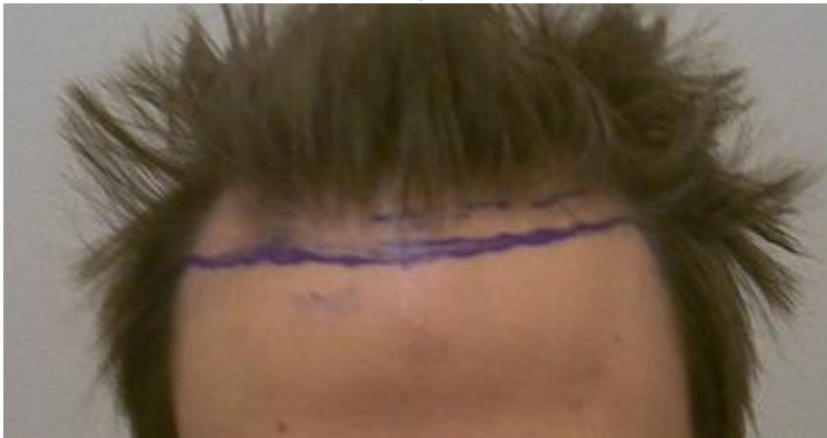
3) tag17.JPG , downloaded 2323 times