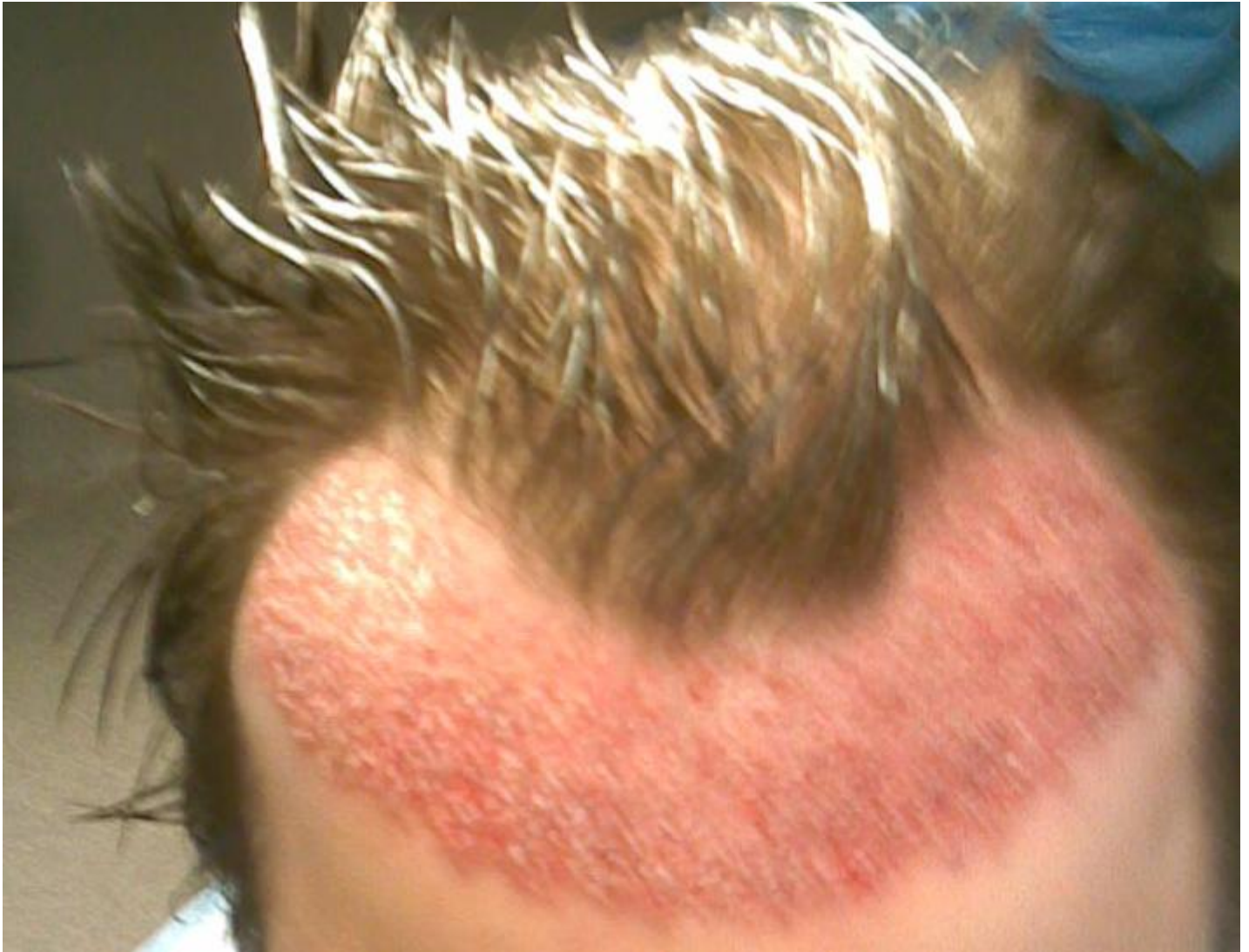
2) haarlinie.JPG , downloaded 2278 times