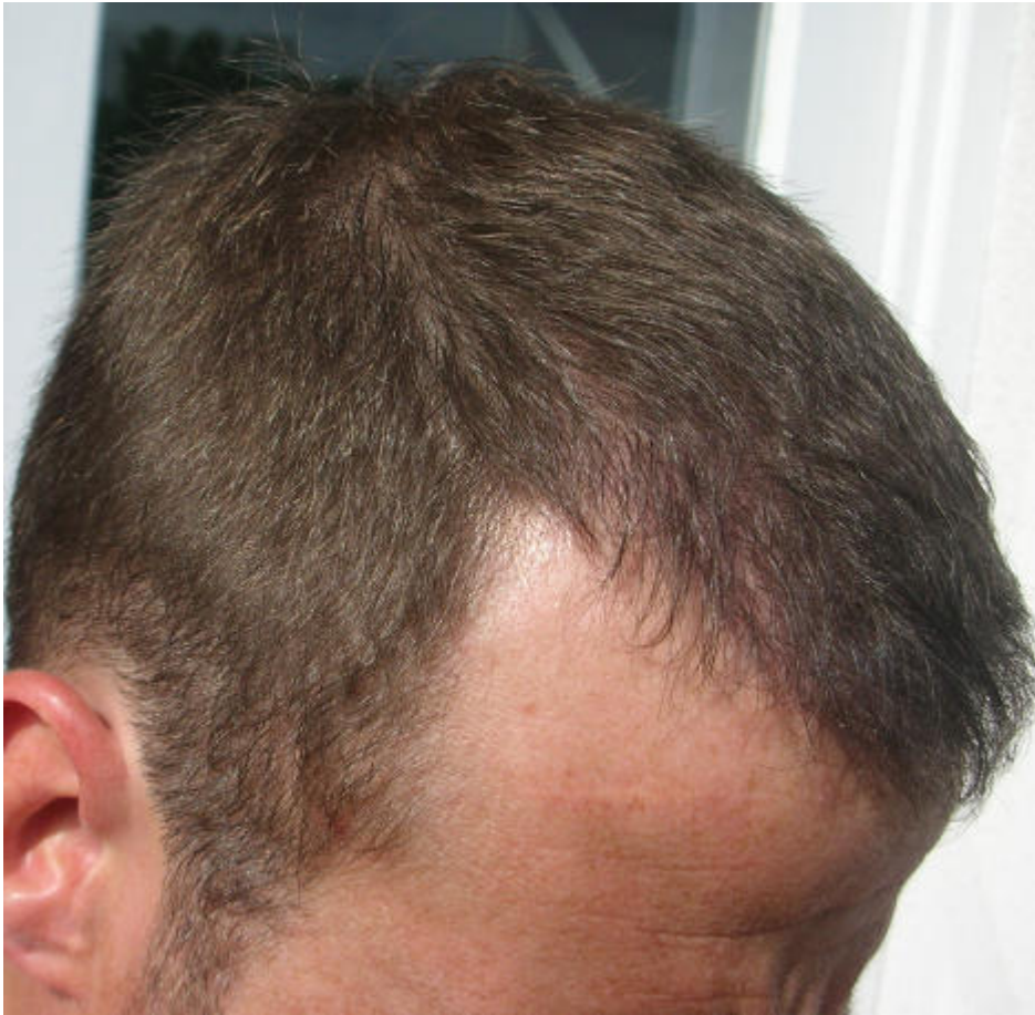
3) Trodden_Indoor_Blitz_VorneII.jpg , downloaded 1255 times