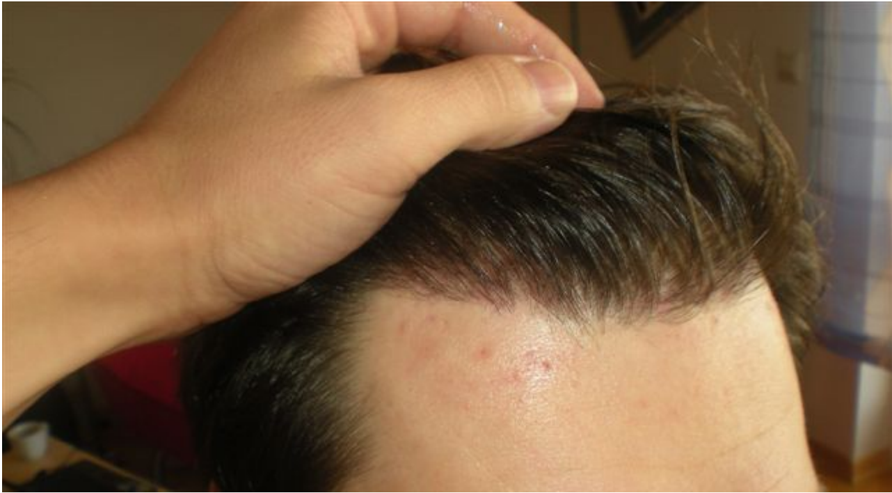
2) DSCN1784.jpg , downloaded 303 times