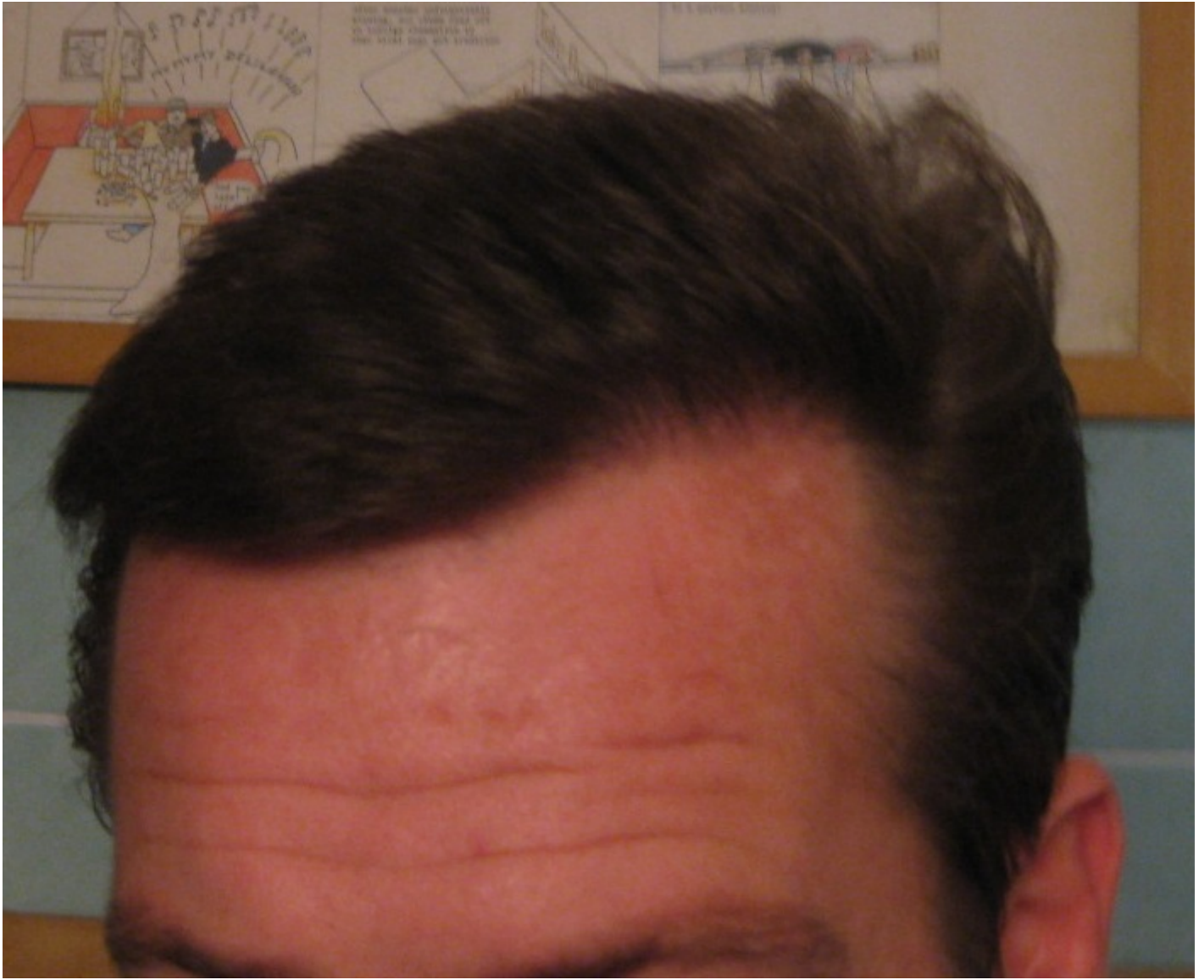
3) Bild 207.jpg , downloaded 326 times