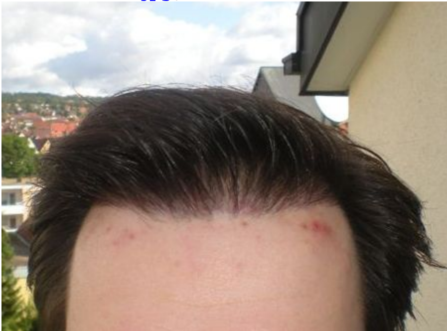
3) DSCN1786.jpg , downloaded 293 times