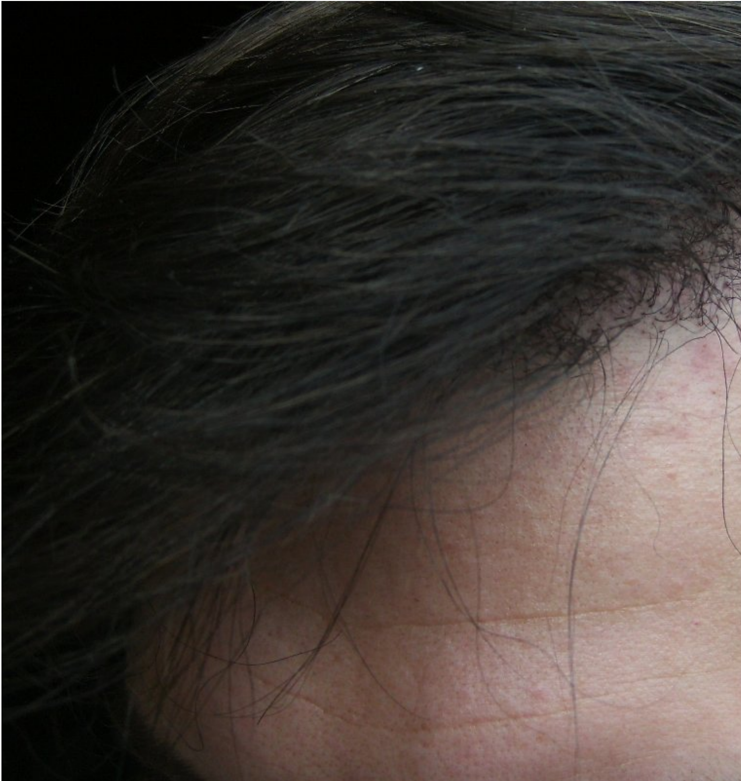
3) 9_5monthHairlineCluseup.jpg , downloaded 290 times