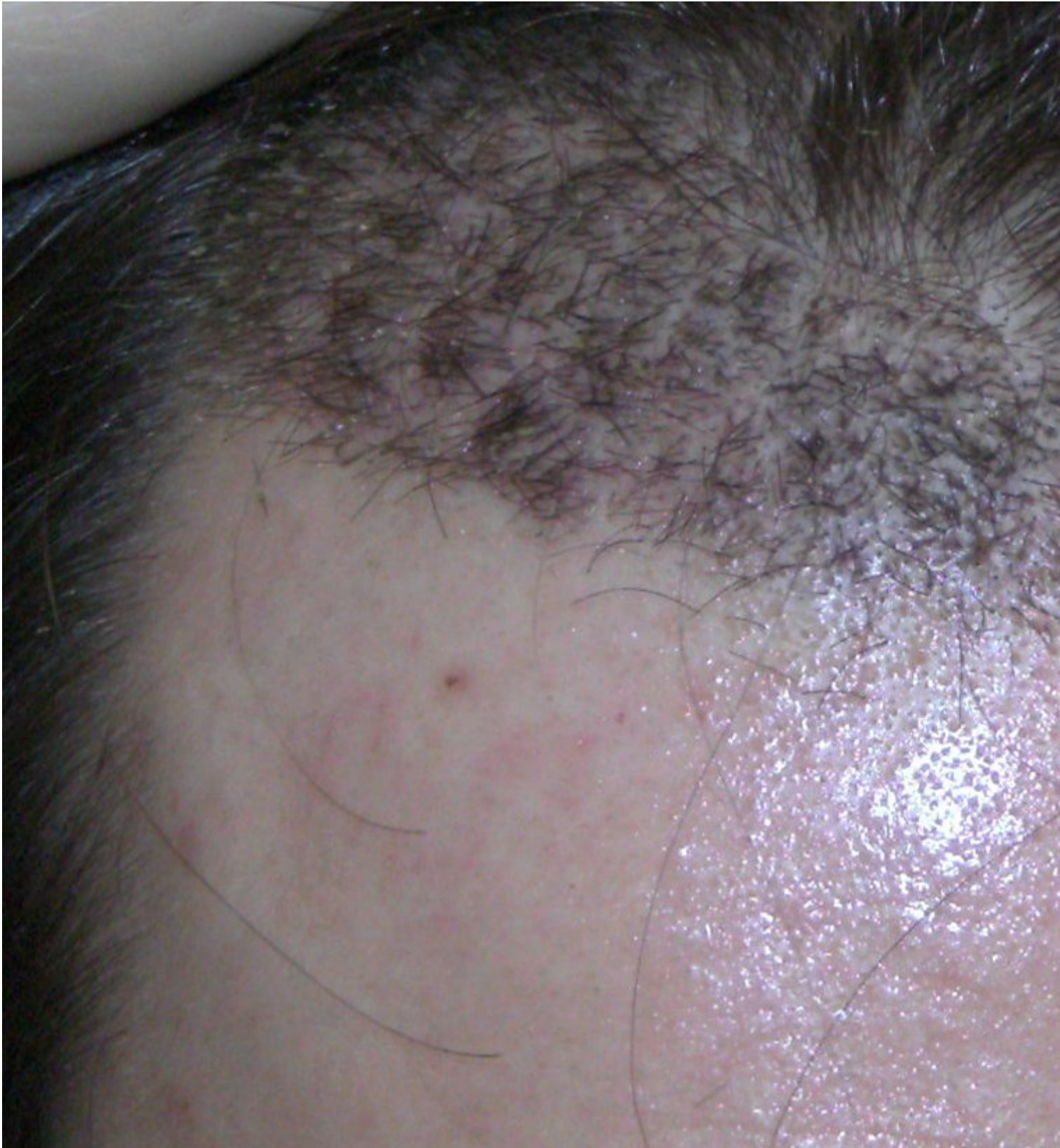
2) 3weeks2.JPG , downloaded 413 times