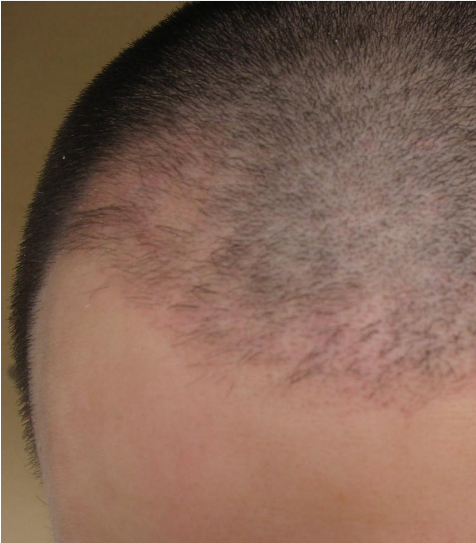
2) IMG_0414.JPG , downloaded 969 times