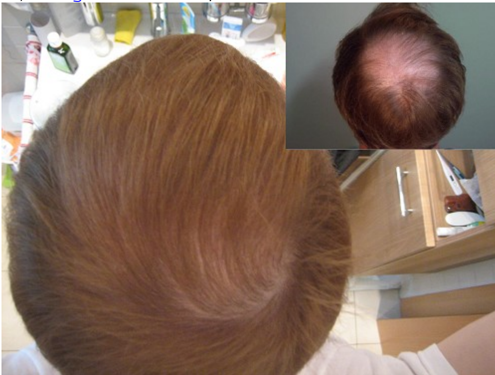
3) Vor_OP,_1,5__Monate,_2_Monate,_knapp_3_Monate.jpg , downloaded 4657 times