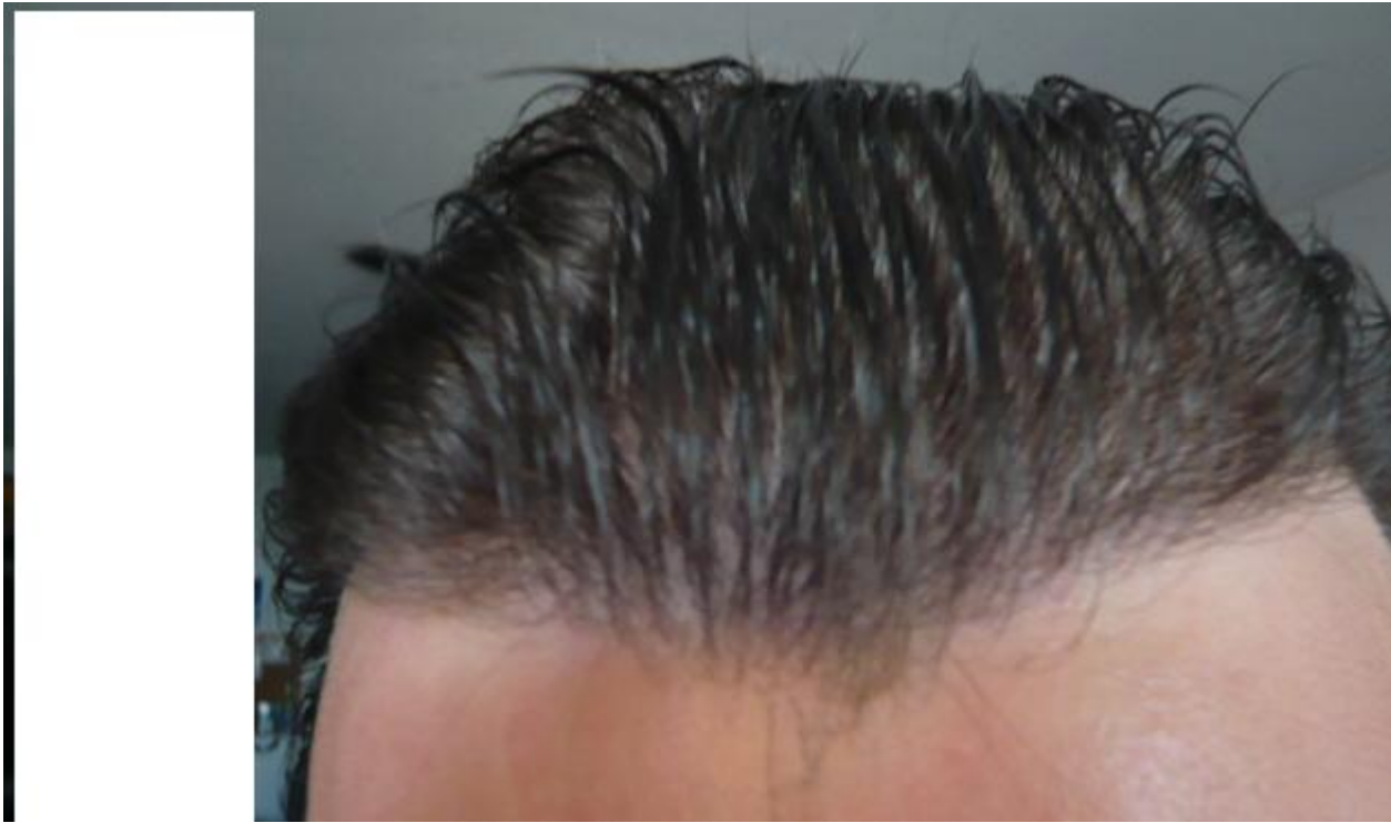
2) nass2.JPG , downloaded 245 times