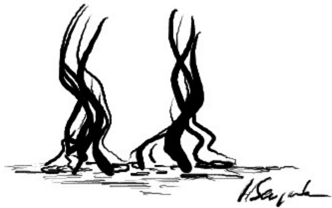
Haare mit z.B. Gel

Subject: Re: 3500 grafts prohairclinic (5.monat Update)